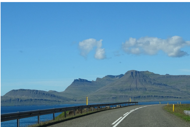
Islands Ostküste