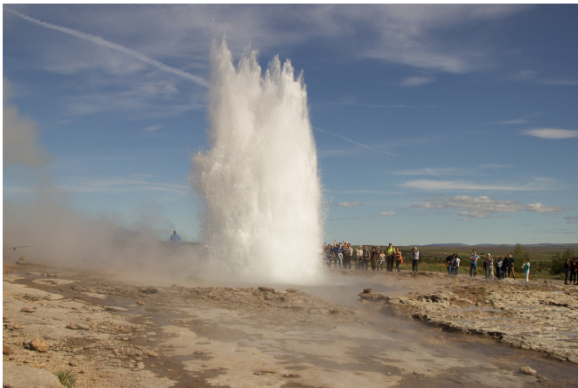
Geysir Strokkur

Erstes Ziel Ihrer Rundreise durch die faszinierenden Landschaften Islands ist der Thingvellir-Nationalpark , der seit 2004 zum UNESCO-Welterbe zählt. An diesem historischen Ort gründeten die Isländer vor mehr als 1000 Jahren ihr erstes Parlament. Im Zentrum des Nationalparks befindet sich die Schlucht Almagnagjá . Bei einem Spaziergang lässt sich gut erkennen, wie hier die Kontinentalplatten Europas und Amerikas auseinanderdriften.