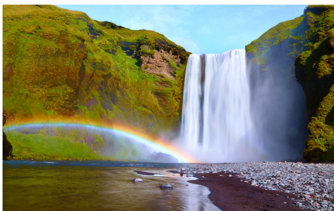
Wasserfall Skógafoss

Vorbei an den schwarzen Stränden von Vík í Mýrdal erreichen Sie zwei der bekanntesten Wasserfälle des Landes. Zunächst sehen Sie den Skógafoss , der vom Fluss Skóga gespeist wird. Von einem Hochplateau stürzt das Wasser 60 Meter in die Tiefe. Nicht weniger spektakulär ist der Seljalandsfoss . Bei einem kurzen, allerdings auch etwas feuchten Weg können Sie unter dem Wasserfall durchgehen.