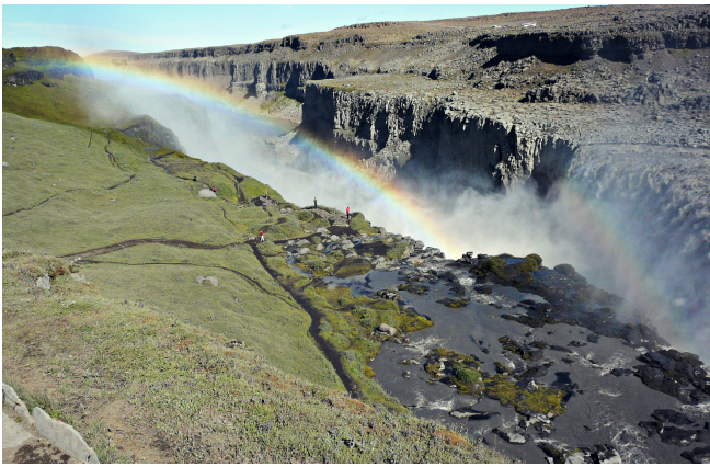
Wasserfall Dettifoss