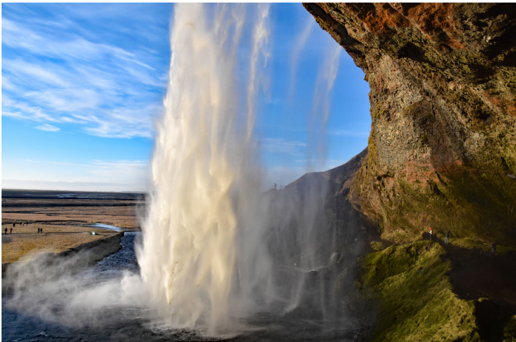
Der Wasserfall Seljandsfoss

In Millionen von Jahren schufen die gegensätzlichen Elemente Feuer und Eis die urwüchsige Naturschönheit Islands. Die fortwährende Aktivität der zahlreichen Vulkane und die Eispanzer der gewaltigen Gletscher bestimmen bis heute den Lebensrhythmus der Atlantikinsel.