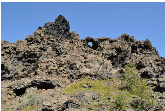
„Schwarze Burgen“ bei Dimmuborgir

Anschließend fahren Sie weiter in das für seine artenreiche Vogelwelt bekannte Naturreservat rund um den See Mývatn . Bei einer kurzen Wanderung entdecken Sie die Pseudokrater , die es in dieser Form nur in Island gibt. Ein landschaftlich ebenso eindrucksvolles Erlebnis ist der Spaziergang durch die fantastischen Landschaften der „ Schwarzen Burgen “ in Dimmuborgir . Nach einem Vulkanausbruch entstanden hier bizarre Lava-Formationen.