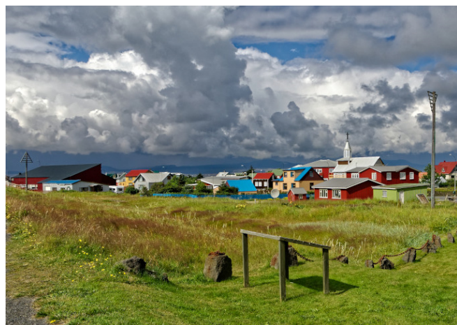
Fischerdorf Eyrarbakki

Zum Auftakt Ihrer letzten Etappe besuchen Sie am Vormittag die beiden Fischerdörfer Eyrarbakki und Thorlákshofn . Anschließend folgen Sie der Küstenstraße in Richtung Westen und erreichen auf landschaftlich eindrucksvoller Strecke den rätselhaften Bergsee Kleifavatn , dessen Wasserspiegel sich in regelmäßigen Abständen hebt und senkt.