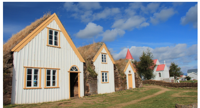
Torfbauernhof Glaumbaer

Zum Auftakt Ihrer heutigen Etappe besuchen Sie den Torfbauernhof Glaumbaer , der aus dem 18. und 19. Jh. stammt. Viele Einrichtungsgegenstände sind originalgetreu erhalten geblieben und bieten einen Einblick in das frühere Leben der Landbevölkerung.