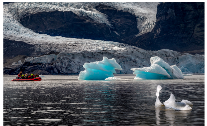
Gletschensee Fjallsárlón

Ein besonderes Erlebnis ist Ihre Bootsfahrt auf dem noch wenig besuchten Gletschensee Fjallsárlón . Auf dem Wasser treiben blau und weiß schimmernde Eisberge und bieten ein beeindruckendes Naturschauspiel. Lassen Sie sich von der faszinierenden Kulisse und den bizarr geformten Eismassen begeistern!