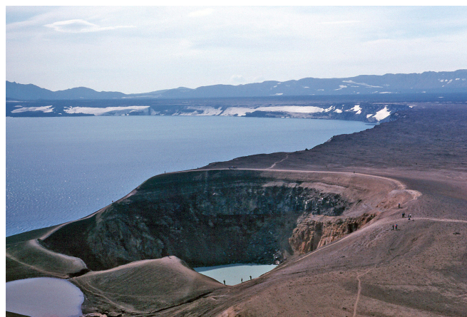
Kraterkessel Askja

Auf der eindrucksvollen Strecke bieten sich herrliche Aussichten auf Bimssteinwüsten , bizarre Basaltformationen und dunkle, mit Lava-Asche überzogene Flächen. Es ist nicht verwunderlich, dass die amerikanischen Astronauten im Jahr 1968 hier für ihre Landung auf dem Mond trainierten. Immer wieder fällt der Blick auf den imposanten Berg Herdubreid , der weithin sichtbar die Szenerie der gesamten Region am Fuße des Gletschers Vatnajökull beherrscht.