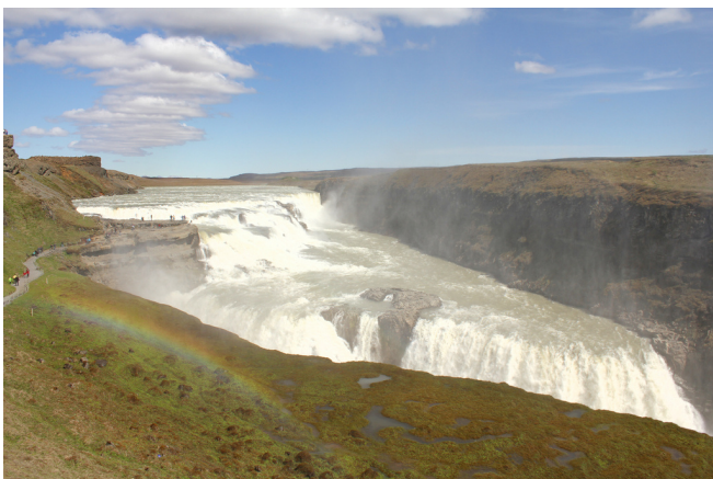
Wasserfall Gullfoss

Anschließend besuchen Sie Islands bekanntestes Geothermalgebiet im Haukadalur. Beeindruckend ist vor allem der Geysir Strokkur , der seinen Strahl aus heißem Wasser und Dampf regelmäßig bis zu 25 m in die Höhe schießt. Nächstes Ziel ist der „ Goldene Wasserfall “ Gullfoss , der in zwei Kaskaden in die Tiefe stürzt.