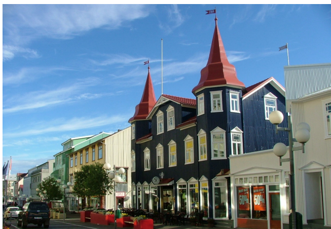
Akureyri CCBYSA puffin11k-at-flickr

Durch einen im Jahr 2010 neu eröffneten Tunnel führt die Straße nach Ólafsfjörður am Eyja-Fjord und weiter entlang der Küste nach Akureyri . Bei einem Spaziergang durch die „ Hauptstadt des Nordens “ sehen Sie einige schöne Holzhäuser und besuchen die auf einem Hügel inmitten der Stadt gelegene Kathedrale . Eine grüne und vor allem im Sommer blühende Oase ist der Botanische Garten , der hoch über dem Fjord liegt und immer wieder herrliche Ausblicke bietet. Anschließend erreichen Sie Ihr Hotel. Zimmerbezug für 1 Übernachtung und gemeinsames Abendessen .