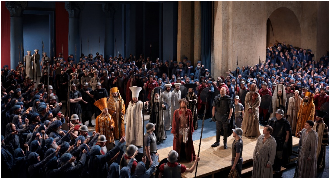
Jesus vor Pilatus

Diese Reise führt Sie nach Oberammergau, eingebettet in eine faszinierende Naturlandschaft und geprägt von lebendigen Traditionen.