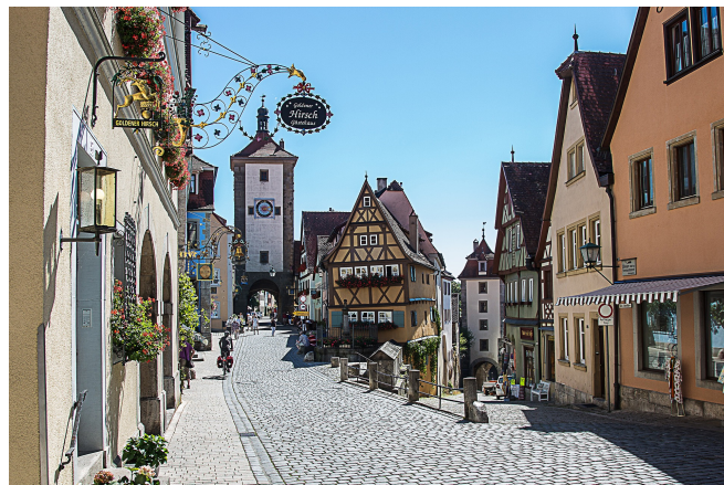
Rothenburg o.d.T.