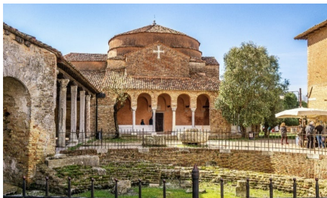
Santa Fosca auf Torcello