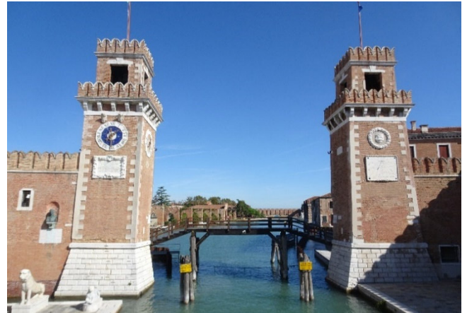
Arsenale 2019

Dieser Tag steht vormittags wieder ganz im Zeichen der Kunst. Mit dem Vaporetto fahren Sie zu den Ausstellungshallen des Arsenale, die ein bemerkenswertes Zeugnis dafür geben, welche große Bedeutung der Schiffsbau für die einstige Großmacht Venedig spielte. Mit fachkundiger Führung geht es durch dieses spannende Kunstareal auf dem ehemaligen Wertgelände.