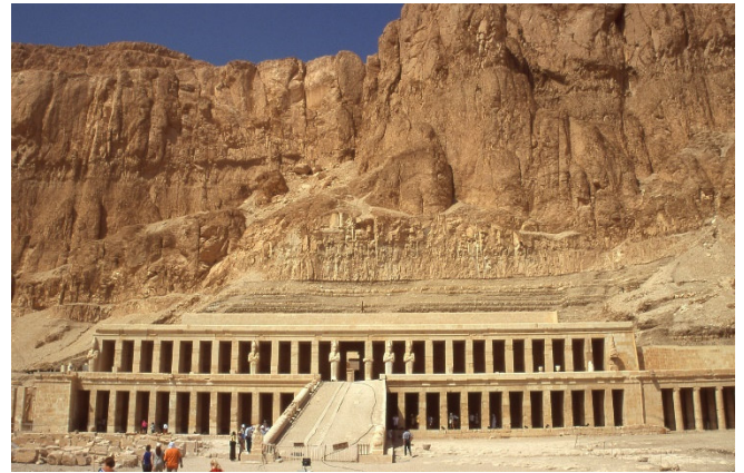
Tempel der Hatshepsut

Einen Eindruck vom Selbstverständnis der Herrschenden bieten auch die zahlreichen Tempelanlagen. Besonders imposant ist der Terrassen-Tempel der Hatshepsut , der sich harmonisch in die natürliche Felskulisse einfügt.