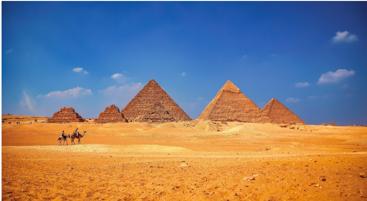
Pyramiden von Gizeh

Der Orient: so nah an Europa und doch so anders. Das Morgenland fasziniert uns schon seit den Geschichten aus 1001 Nacht. Spätestens seit der Entdeckung des Grabes des jungen Pharaos Tutanchamun durch Howard Carter geht von den Baudenkmalern, Gräbern und Kultstätten des Orients eine mystische und faszinierende Wirkung aus.