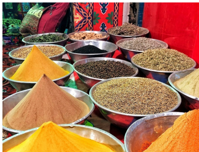
Gewürze auf dem Basar CC0 pixabay

Da sich die Moschee inmitten des Alten Basars von Sharm-El-Sheikh befindet, haben Sie anschließend etwas Zeit, um über den Markt zu bummeln. Tauchen Sie ein in die farbenfrohe Welt des Orients mit unzähligen Ständen voller Handwerkskunst, kulinarischen Leckereien, bunten Stoffen und duftenden Gewürzen.