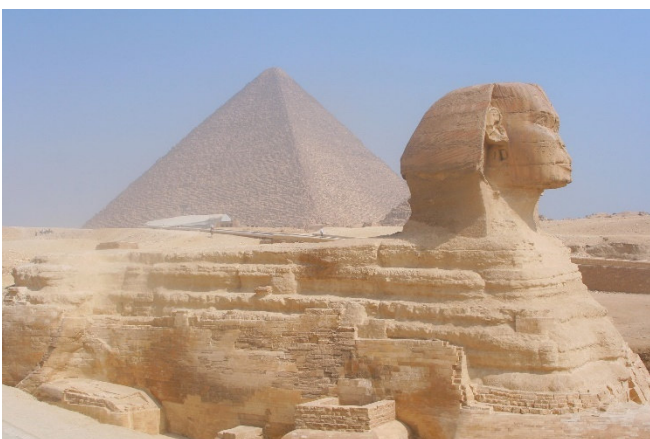
Sphinx von Gizeh

Mit der Mykerinos-Pyramide (Außenbesichtigung) sehen Sie die kleinste Pyramide des Plateaus. Sie ist nur etwa halb so groß wie ihre „großen Schwestern“. Auch sie wurde mit Kalkstein verkleidet, die inneren Lagen bestanden aus Rosengraniteinfassungen.