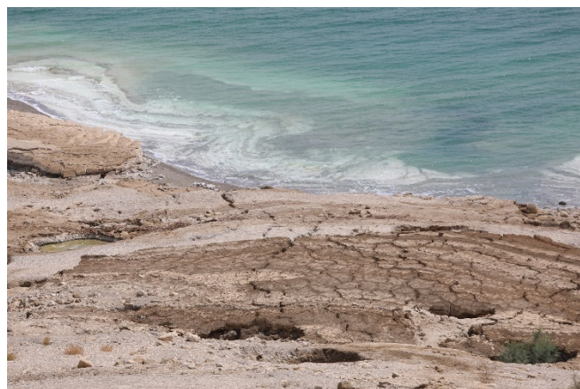
Am Toten Meer

Zurück im Hotel, können Sie die heilende Kraft des mineral- und salzreichen Wassers des Toten Meeres selbst ausprobieren. Sie befinden sich hier mit ca. 400 Metern unter dem Meeresspiegel am tiefsten See der Erde. Beim gemeinsamen Abendessen werden Sie sicher die Reise noch einmal Revue passieren lassen.