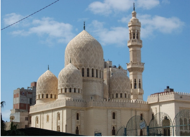
Abu al Abbas el-Mursi Moschee

Bevor es wieder nach Kairo geht besuchen Sie die Abu al Abbas el-Mursi Moschee , die zu Ehren des Heiligen aus Andalusien errichtet wurde. El-Mursi, der Sufiheilige , lebte im 13. Jh. bis zu seinem Tod als Gelehrter in Alexandria. Der auffällig schöne Bau mit andalusischen Stilelementen und italienischen Säulen aus Rosengranit wurde erst 1945 fertig gestellt.