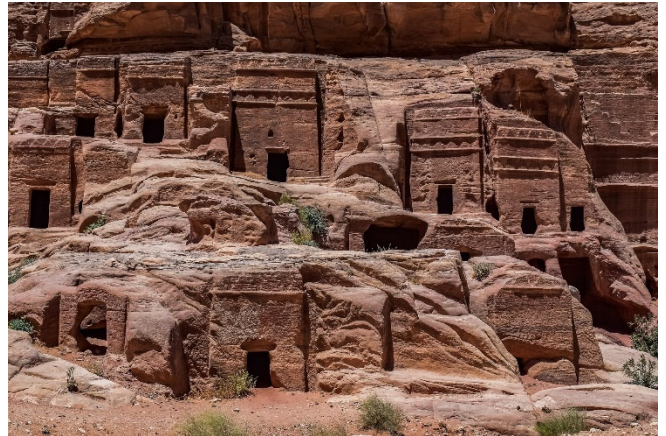
Little Petra

Danach setzen Sie die Reise fort und erreichen das verborgene Tal von Little Petra , das weitgehend unbekannt ist und von Touristen kaum besucht wird. Vom Siq al Barid (kalte Schlucht) aus geht es durch die Baida Region in Richtung der Schluchten von Petra, bis Sie das Kloster hoch über dem Hauptplatz erreicht haben. Hier erwarten Sie herrliche Ausblicke über den Grabenbruch des Wadi Araba .