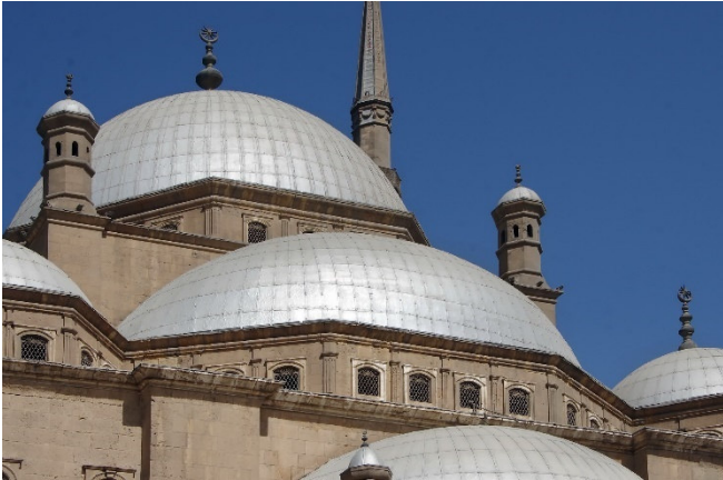
Alabaster-Moschee in Kairo

Linienflug mit Turkish Airlines von Köln/Bonn über Istanbul nach Kairo. Erledigung der Einreiseformalitäten und Begrüßung durch Ihre örtliche Reiseleitung. Transfer zu Ihrem Hotel im Zentrum von Kairo und Zimmerbezug für 3 Übernachtungen. Mit einem gemeinsamen Abendessen im Hotel klingt der Tag aus.