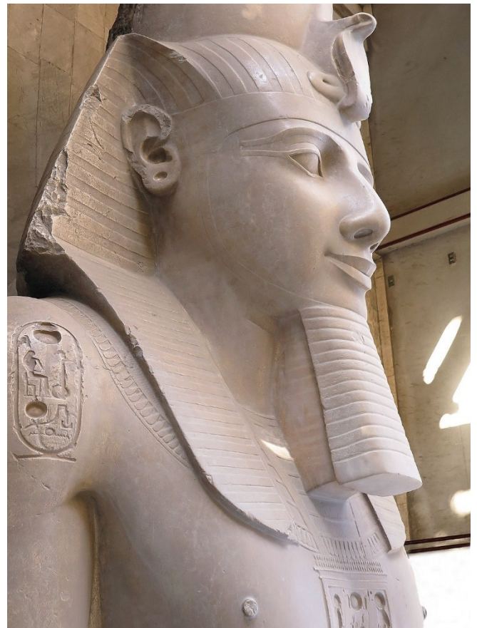
Kolossal-Statue Ramses II im Eingang des GEM in Kairo

Gemeinsames Mittagessen in einem Restaurant in Gizeh.