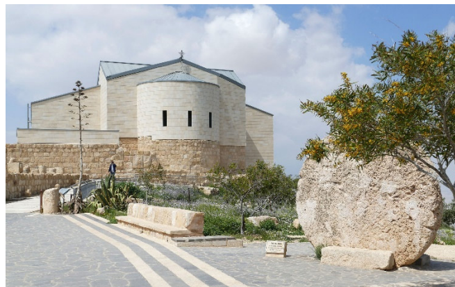
Moses-Gedächtniskirche auf dem Berg Nebo

Weiterfahrt zum heiligsten Ort Jordaniens : Auf dem Berg Nebo soll sich das Grab Moses befinden. Bereits im 4. Jh. errichtete man hier eine Kirche zu seinen Ehren und der Berg wurde zur christlichen Pilgerstätte. Wie einst Moses auf das „ Gelobte Land “, blicken auch Sie vom Gipfel des Nebo auf das weite Panorama, das sich eindrucksvoll vom Jordantal und dem Toten Meer über Jericho bis nach Jerusalem erstreckt.