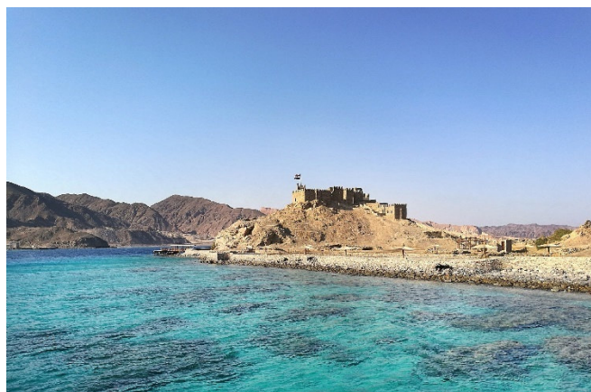
Am Roten Meer

Das Abendessen ist in den All Inclusive-Leistungen des Hotels enthalten.