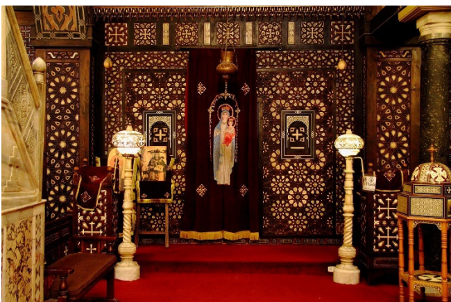
Hängende Kirche

Im farbenfrohen Souk al Fustat haben Sie etwas Zeit für individuelle Entdeckungen. In einem nahe gelegenen Restaurant werden Sie zu einem gemeinsamen Mittagessen erwartet.