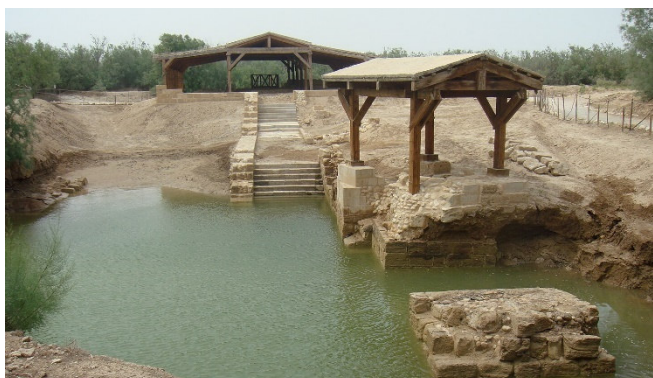
Taufstelle am Jordan

Am Vormittag führt ein Ausflug nach Bethanien . Nach biblischer Überlieferung befand sich hier am Ufer des Jordan die Stelle, an der Johannes der Täufer Jesus getauft hat. An dieser Stelle feiern Sie einen gemeinsamen Gottesdienst. Anschließend besuchen wir die Ausgrabungen der antiken Stätte, die seit 2015 zum UNESCO-Weltkulturerbe zählen.