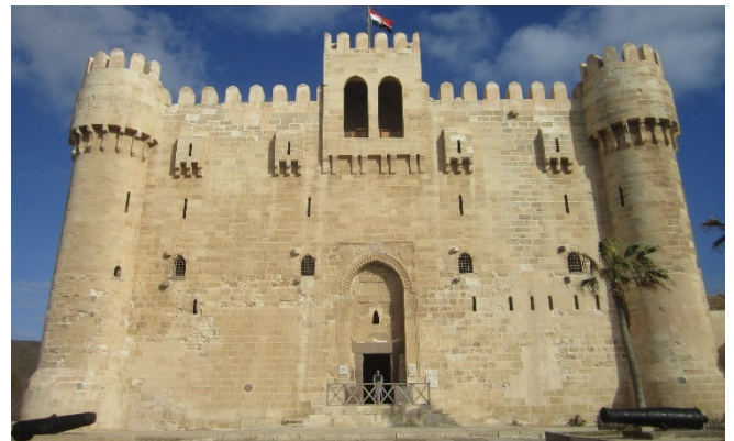
Zitadelle von Qaitbay

Zum Auftakt besuchen Sie die Neue Bibliothek . Das Großprojekt beherbergt nicht nur einen immensen, dreisprachigen Buchbestand, sondern auch Museen, Kunstgalerien und Forschungszentren. Es wurde mit Hilfe der UNESCO in der Nähe der einstigen, bedeutenden Alexandria-Bibliothek errichtet, die durch einen Brand und spätere Erdbeben völlig zerstört wurde.