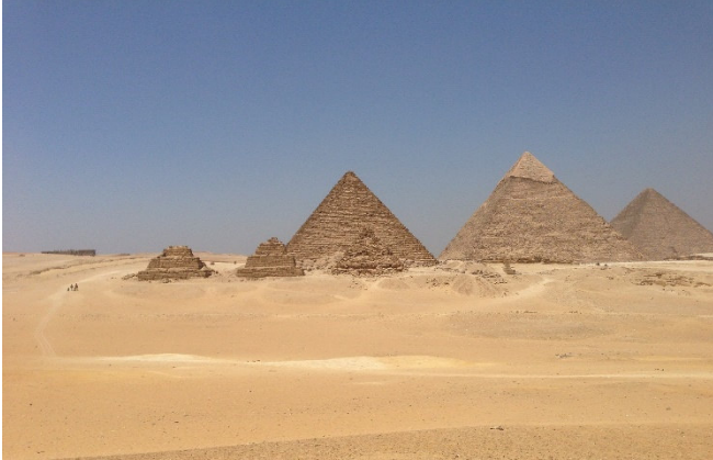
Pyramiden von Gizeh

Am Nachmittag widmen Sie sich den Pyramiden von Gizeh – seit 1979 UNESCO-Weltkulturerbe . Sie stammen vermutlich aus der Zeit zwischen 2620 und 2490 v. Chr. Ihre Erbauung war ein unvorstellbares Unterfangen. Jeder Steinquader wiegt Tausende von Kilo, und es ist bis heute nicht genau erforscht, wie die alten Ägypter diese enorme Aufgabe ohne moderne Technik leisten konnten.