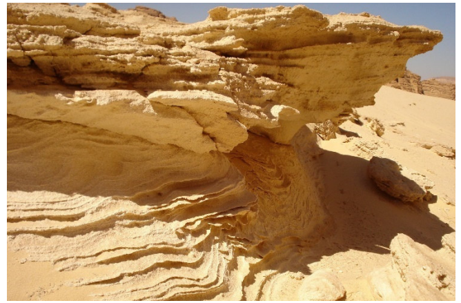
Felsen auf dem Sinai CC0 pixabay

Und schon tauchen Sie ein in die Faszination Sinai , in die Heimat der Jebeliya-Beduinen , die in der Einsamkeit des Gebirges, in der Stille der Wüste und in den fruchtbaren Oasen ihren perfekten Lebensraum gefunden haben. Sie leben hier schon seit über 1400 Jahren , denn im 6. Jh. befahl der byzantinische Kaiser Justinian den Bau des Katharinenklosters und postierte hier 200 Soldaten mit ihren Familien, um das Kloster zu schützen. 100 dieser Männer wurden aus Ägypten gebracht und die anderen 100 aus verschiedenen Teilen des Byzantinischen Reiches. Seitdem hat sich dieses Volk seine uralten Kulturen bewahrt.