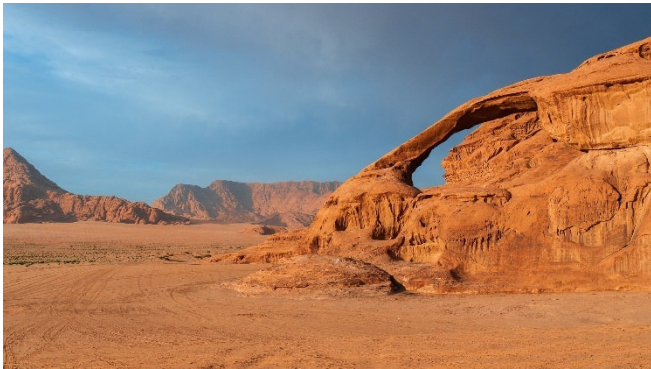
Felsformation im Wadi Rum

Am Nachmittag setzen Sie die Fahrt in Richtung Wüste fort. Dem legendären Desert Highway folgend, erreichen Sie das Wadi Rum . In der mystischen Kulisse dieses weltberühmten Naturreservats werden die Geschichten um Lawrence von Arabien lebendig.