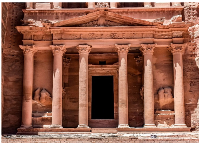
Schatzhaus des Pharaos in Petra

Nach dem Spaziergang durch den Siq , einer 1200 Meter langen und 70 Meter hohen Schlucht, bildet die imposante Felspalte den Eingang zur Felsenstadt. Bei einer minimalen Breite von drei Metern versteht man gut, welchen Beitrag der Siq einst zur Verteidigung der Stadt leistete. Alle Karawanen, die in Petra Station machten mussten ihn zunächst passieren, so wie Sie heute. Plötzlich endet der Schacht (Siq) und die eindrucksvolle Schatzkammer des Pharaos , wie die Beduinen das weltberühmte Bauwerk nannten, liegt vor Ihnen. Sie vermuteten reiche Schätze in der großen Urne auf der Spitze, es handelt sich jedoch um eine Grab- und Kultstätte .