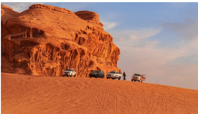
Jeep-Tour im Wadi Rum

Per Jeep erleben Sie heute die Schönheit des Wadi Rum mit all seinen Schluchten, Tälern, Dünen und Felsformationen. In den zahlreichen Canyons finden sich Felszeichnungen aus prähistorischer Zeit , das Gebirge aus Granit und Sandstein beeindruckt mit spektakulären Felsbrücken und die herrliche Wüstenlandschaft strahlt in rötlicher Farbe.