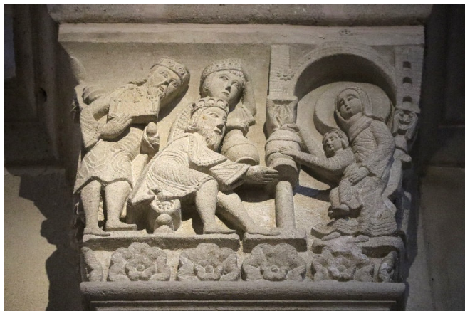
Kapitell in Autun

Nächstes Ziel ist die alte römische Provinzhauptstadt Autun , die sich stolz als „Schwester Roms“ bezeichnete. Bei einer Rundfahrt sehen Sie einige der antiken Monumente, die bis heute erhalten geblieben sind.