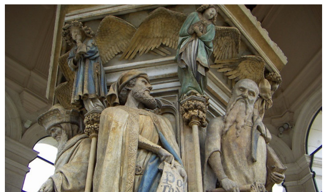
Mosesbrunnen CCBYSA3.0 Welleschik at-wikimedia.commons

Ein letzter Besuch in Dijon gilt der etwas außerhalb des Stadtzentrums liegenden ehemaligen Kartause von Champol mit dem Mosesbrunnen von Claus Sluters . Die ausdrucksstarken Figuren der Propheten gehören zu den Meisterwerken des aus den Niederlanden stammenden Künstlers.