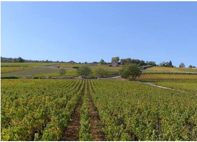
Weinberge im Côte d'Or

Ihre Rückfahrt führt durch die berühmten Weinlagen der Côte d'Or . Hier werden die ausgezeichneten Rot- und Weißweine produziert, für die Burgund in der ganzen Welt bekannt ist. Wie Perlen an einer Kette reihen sich Weingüter mit klangvollen Namen und kleine Winzerdörfer aneinander. Dazwischen bieten sich schöne Aussichten auf die scheinbar unendlich scheinenden Weinreben. Mit einer Weinverkostung auf einem namhaften Château klingt der Tag aus.