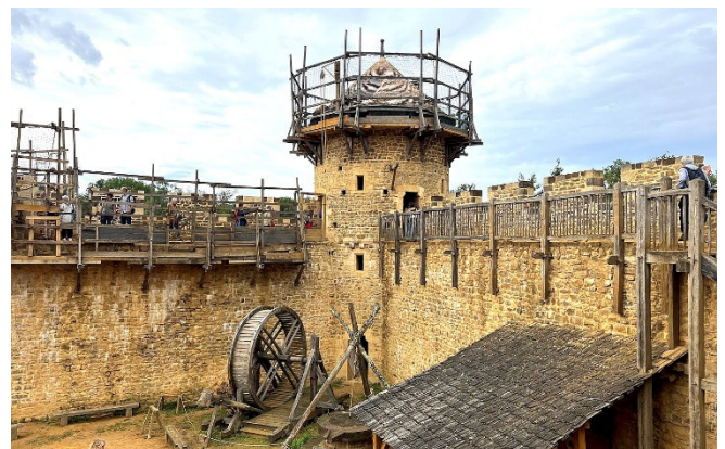
Burg von Guédelon

Danach besichtigen Sie die Burg von Guédelon . Seit mehr als 25 Jahren entsteht eine beeindruckende Anlage, die den Historikern und Archäologen wertvolle Erkenntnisse über die Bautechnik des Mittelalters vermittelt. Bei einer Führung über die lebendige Baustelle erhalten Sie spannende Einblicke in das Leben und die Arbeit der Handwerker vor mehr als 800 Jahren.