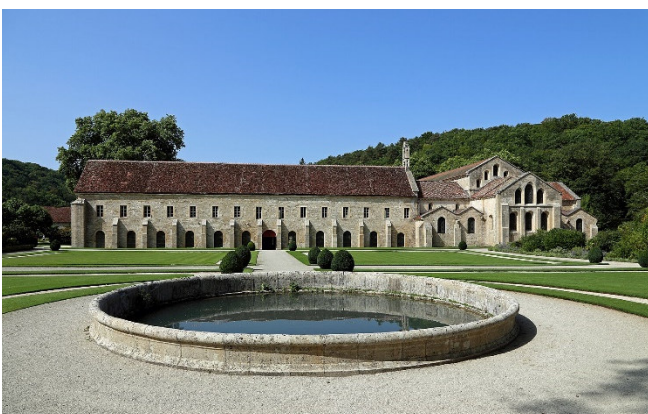
Abtei Fontenay

Am Nachmittag besuchen Sie die Zisterzienserabtei Fontenay. Die mittelalterliche Klosteranlage wurde im Jahr 1118 von Bernhard von Clairvaux gegründet und vermittelt ein anschauliches Bild vom Leben und Wirken der Mönche.