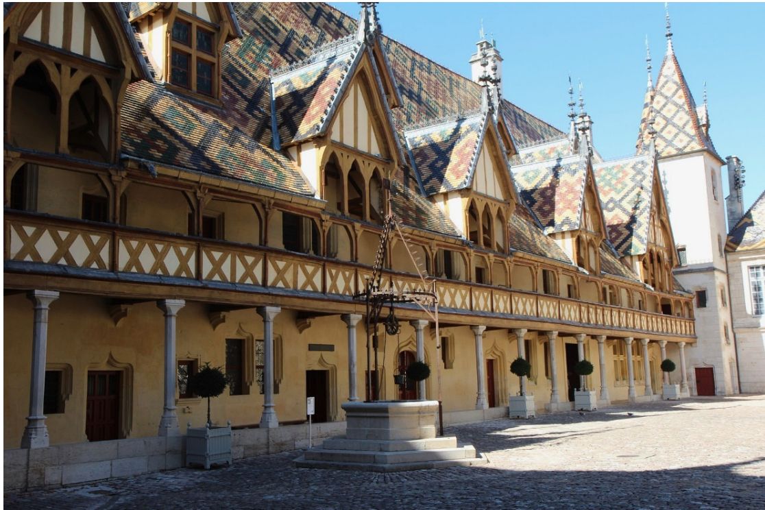
Hôtel-Dieu in Beaune

Eine bezaubernde Landschaft mit ihren Klöstern, Kirchen und Städten erzählt die Geschichte ihrer Bedeutung für das mittelalterliche Europa. Über viele Jahrhunderte war Burgund eines der führenden geistigen, kulturellen und politischen Zentren unseres Kontinents . Weit über die Region hinaus prägten die Abtei von Cluny und der von Bernhard von Clairvaux gegründete Orden der Zisterzienser das klösterliche Leben. Im ausgehenden Mittelalter waren es dann die Herzöge von Burgund , die durch wirtschaftliches Geschick, Diplomatie und mutige Kriege für kurze Zeit ein europäisches Großreich schufen.