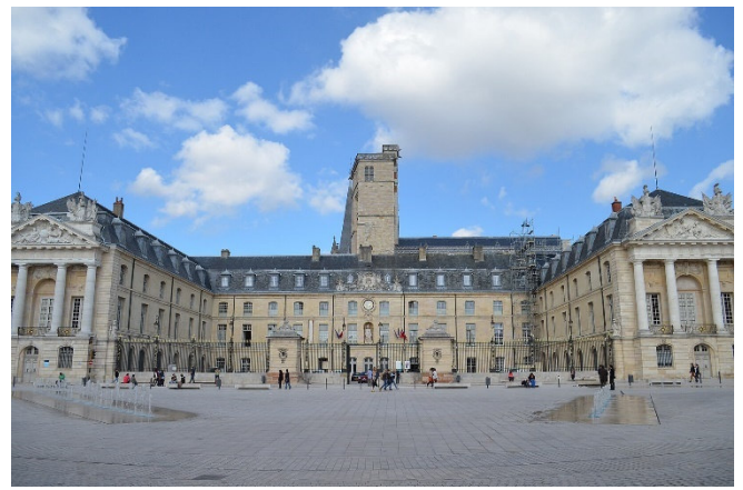
Herzogspalast in Dijon

Mit Ihrem Hotel in Dracy-le-Fort, einem Dorf in der Nähe von Chalon-sur-Saône, erreichen Sie den zweiten Standort Ihrer Reise. Nach dem Zimmerbezug für 3 Übernachtungen werden Sie im Restaurant des Hotels zum Abendessen erwartet.