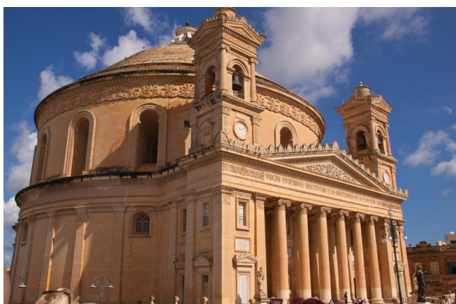
Rotunde von Mosta

Rückfahrt zum Hotel und gemeinsames Abendessen.