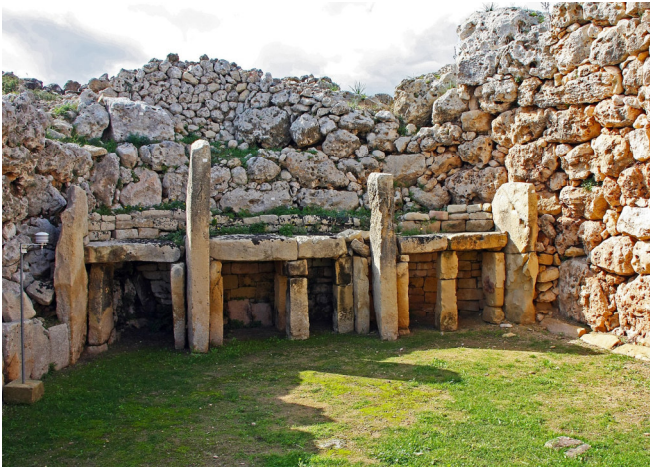
Ggantija auf Gozo