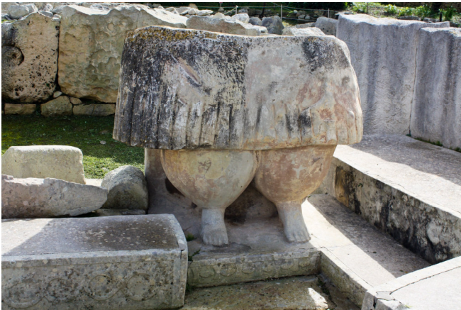
Kolossalstatue „Magna Mater“ in Tarxien

Bei einem gemeinsamen Abendessen im Hotel lernen Sie die anderen Teilnehmer der Reise kennen und lassen den Tag entspannt ausklingen.