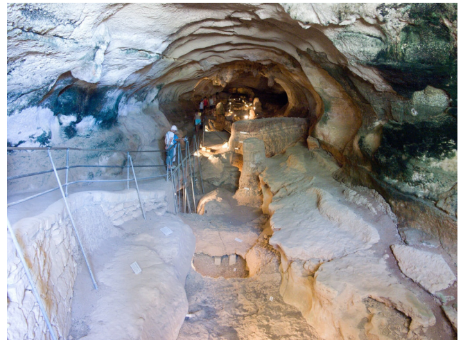
Ghar Dalam

Danach besuchen Sie Ghar Dalam , die Höhle der Finsternis, eine der ersten Wohnstätten der Ureinwohner Maltas. Die Karsthöhle aus dem Jahr 5000 v. Chr. war eine bedeutende Fossilagerstätte . Die wichtigsten Funde sind heute in einem Museum oberhalb der Höhle ausgestellt.