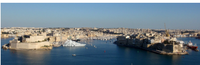
Die „Drei Städte“

Anschließend besichtigen Sie die „ Drei Städte “, womit auf Malta die historischen Städte Vittoriosa, Senglea und Cospicua gemeint sind. Diese liegen direkt gegenüber von Valletta. Vittoriosa, das von den Maltesern meist noch nach ihrem mittelalterlichen Namen Birgu genannt wird, war das erste Hauptquartier der Johanniter um 1530 . Entsprechend ist das Stadtbild von den Bauten aus dieser Zeit bestimmt, wovon