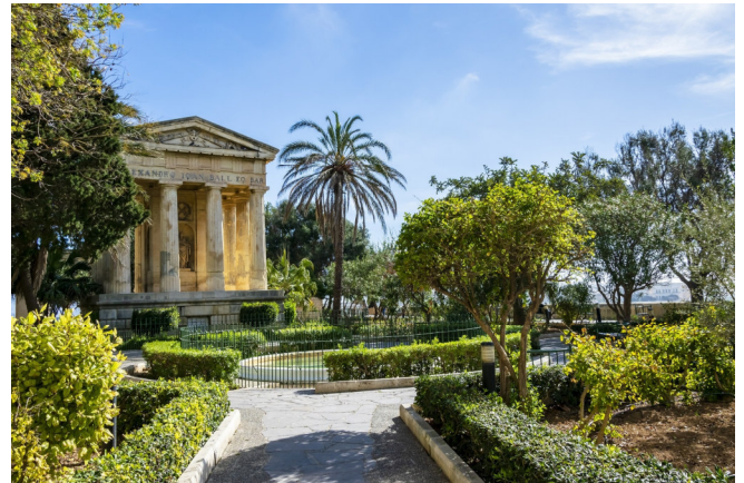
Barrakka Gärten in Valletta CC0 pixabay

Von der Valletta Waterfront ausgehend spazieren Sie das Ufer entlang und fahren mit dem Barrakka-Aufzug zu den Barrakka-Gärten. Seit gut 10 Jahren verbindet der Aufzug die Waterfront mit den Gärten und ist somit auch der schnellste Weg ins Stadtzentrum . Von den Gärten aus genießen Sie eine herrliche Aussicht auf das Panorama mit der Befestigungsanlage und dem großen Hafen.