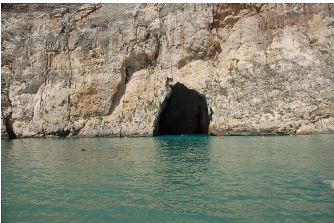
Inlandsee auf Gozo

Welche Kraft die Natur und das Wasser haben, sehen Sie am Dwejra Point . Die steilen Klippen an der beeindruckenden Küstenlinie erreichen eine Höhe von bis zu 130 m. Auch entstand hier vor wahrscheinlich mehreren Millionen Jahren der Inlandsee, der mit einem Tunnel durch die Felswand mit dem Meer verbunden ist.