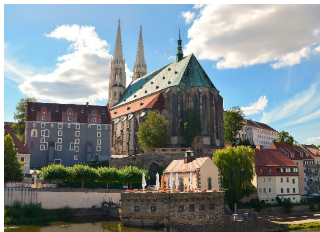
Pfarrkirche St. Peter und Paul