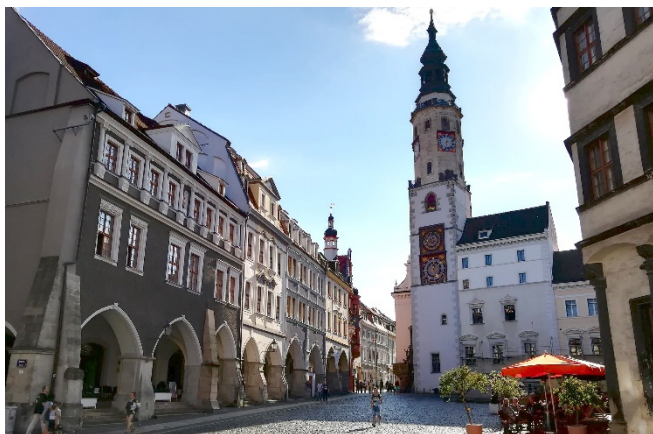
Untermarkt mit Altem Rathaus

Nach dem Zimmerbezug für die kommenden 6 Nächte klingt der Tag mit einem gemeinsamen Abendessen im Restaurant Ihres Hotels aus.