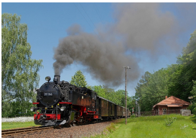
Zittauer Schmalspurbahn

Am Nachmittag erwartet Sie ein besonderes Erlebnis, das nicht nur Eisenbahnfreunde begeistern wird. Mit dem historischen Dampfzug der Zittauer Schmalspurbahn fahren Sie in den beschaulichen Kurort Oybin an der Grenze zu Tschechien. Gemächlich zuckelt der nostalgische Zug durch die Wälder und Täler im romantischen Naturpark Zittauer Gebirge.