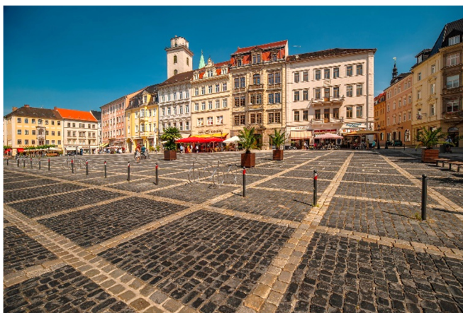
Marktplatz von Zittau

Danach fahren Sie weiter in die 1000-jährige Stadt Zittau . Sie spazieren über den Marktplatz, sehen stattliche Bürger- und Patrizierhäuser aus der Zeit des Barocks und besuchen die ehemalige Kirche zum Heiligen Kreuz in der das „ Große Zittauer Fastentuch “ ausgestellt wird. Das im Jahr 1472 gestiftete Leinentuch ist das größte seiner Art in ganz Europa und zeigt auf insgesamt 90 Feldern biblische Szenen von der Schöpfung bis zum Jüngsten Gericht.