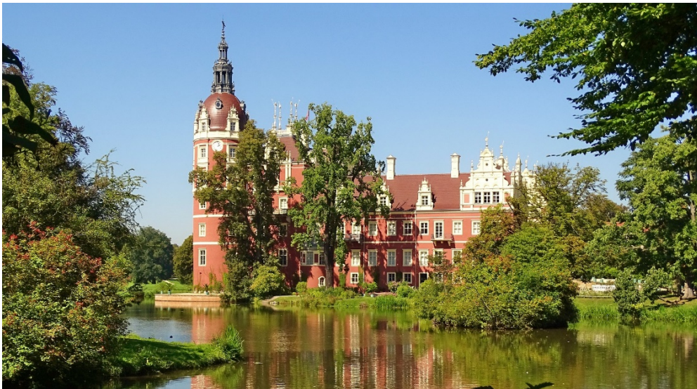
Landschaftspark Bad Muskau

Ganz im Herzen Europas und doch fernab der großen Metropolen überrascht der vielen Besuchern noch unbekanntes Osten Deutschlands mit einem großartigen Kulturerbe und herrlichen Landschaften . Vom einstigen Reichtum der Region im Dreiländereck zu Polen und Tschechien zeugen viele historische Stadtbilder , die in den vergangenen Jahrzehnten umfangreich und liebevoll restauriert wurden.