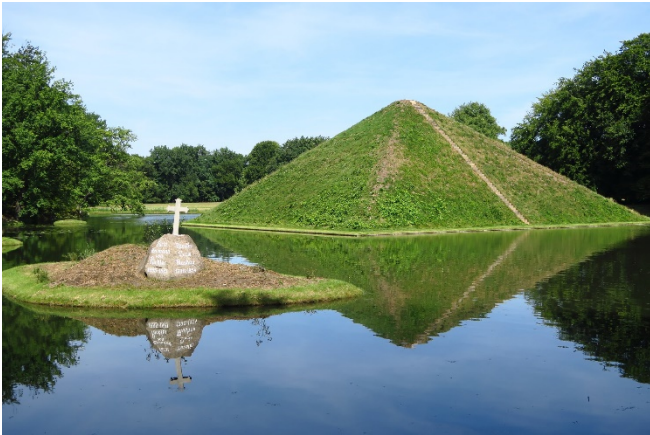
Erdpyramide im Park Branitz

Nach der Mittagspause begegnen Ihnen ein weiteres Mal die Gartenträume von Fürst von Pückler-Muskau. Nachdem er sein Schloss und den Landschaftspark in Muskau verkaufen musste, begann er 1846 mit der Umgestaltung von Schloss Branitz und der Anlage eines weitläufigen Landschaftsparks. Einzigartig sind die beiden Erdpyramiden , die zu den Höhepunkten romantischer Gartenbaukunst in Deutschland zählen. In einer der Pyramiden fanden der Fürst und seine Frau ihre letzte Ruhestätte.