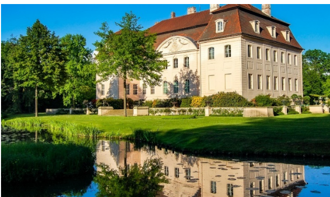
Schloss Branitz

Am späten Nachmittag Rückfahrt nach Görlitz und gemeinsames Abendessen im Hotel.