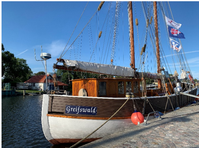
Museumshafen Greifswald

Auf Ihrer Weiterreise an den Greifswalder Bodden besichtigen Sie in Triebsees die Kirche St. Thomas , benannt nach Thomas Becket, dem Erzbischof von Canterbury. Der wuchtige Turm der Backsteinkirche stammt noch aus spätromanischer Zeit. Von kunsthistorischer Bedeutung ist der reich dekorierte Mühlenaltar.