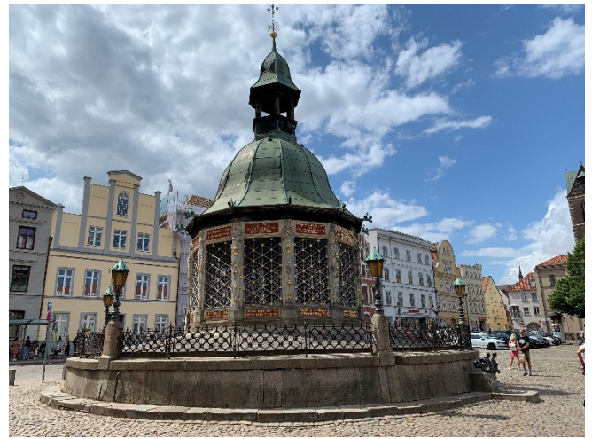
Wasserkunst in Wismar

Nur wenige Schritte weiter erhebt sich der mächtige und weithin sichtbare Turm der im 2. Weltkrieg zerstörten Marienkirche , der zu den Wahrzeichen der Stadt gehört. Eine 3-D-Filmvorführung , macht den Bau der mittelalterlichen Kirche anschaulich.