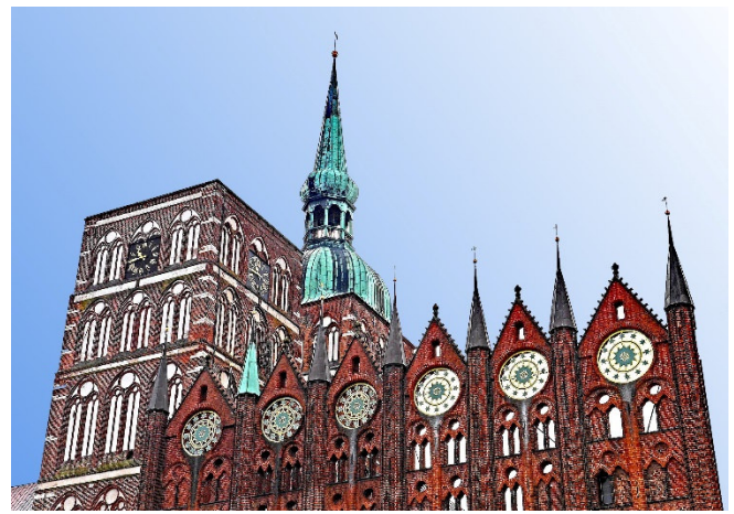
Backsteinarchitektur in Stralsund

Anschließend fahren Sie weiter in die Hafen- und Hansestadt Stralsund. Ihr Hotel in der Altstadt befindet sich in fünf historischen Gebäuden , in denen auch eine mehrfach ausgezeichnete Kaffeerösterei untergebracht ist. Nach dem Zimmerbezug für 1 Nacht werden Sie im Hotelrestaurant zum Abendessen erwartet. Danach bietet sich die Gelegenheit zu einem ersten Bummel durch Stralsunds Altstadt und den Hafen.