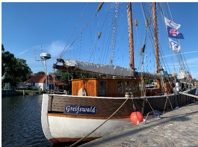
Museumshafen Greifswald

Auf Ihrer Weiterreise an den Greifswalder Bodden besichtigen Sie in Triebsees die Kirche St. Thomas , benannt nach Thomas Becket, dem Erzbischof von Canterbury. Der wuchtige Turm der Backsteinkirche stammt noch aus spätromanischer Zeit. Von kunsthistorischer Bedeutung ist der reich dekorierte Mühlenaltar.