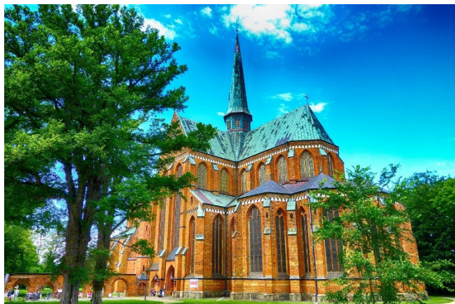
Münsterkirche in Bad Doberan

Lange bevor die Großherzöge von Mecklenburg und das wohlhabende Bürgertum die Heilbäder entdeckten, gründeten Zisterziensermönche im 12. Jh. ein Kloster, dessen nahezu original erhaltene Klosterkirche, das Bad Doberaner Münster , zu den schönsten Beispielen der Backsteingotik an der Ostseeküste gehört.