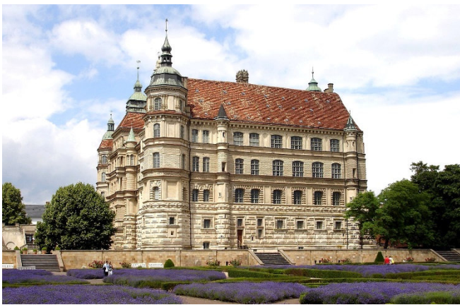
Schloss Güstrow