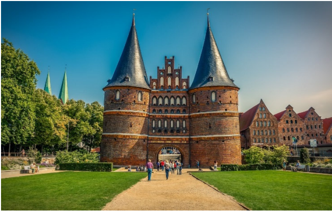
Holstentor in Lübeck

Am Morgen Abfahrt im modernen Fernreisebus ab Köln (Vorübernachtung in Köln und weitere Zustiege auf Anfrage). Vorbei an Hamburg erreichen Sie am Nachmittag Lübeck, die vielgerühmte „ Königin der Hanse “. Das bekannteste Wahrzeichen der Stadt ist das Holstentor . Mit seinen zwei wuchtigen Rundtürmen ist es ein starkes Symbol für Wohlstand und Macht einer selbstbewussten Bürgerschaft (Außenbesichtigung).