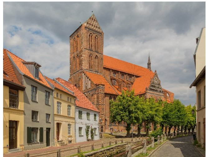
Kirche St. Nicolai in Wismar

Nächstes Ziel ist das Heiligen-Geist-Spital , dessen kunstvoll dekoriertes Tor zum malerischen Kirchhof der beliebten Krimiserie „SOKO Wismar“ als Kulisse dient. In der Spitalkirche sehen Sie den barocken Hauptaltar und die mit Malereien geschmückte Balkendecke. Die Mittagspause verbringen Sie im Alten Hafen , in dem typische Fischkutter schmackhafte Fischspezialitäten anbieten.