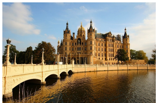
Schweriner Schloss

Nächstes Ziel ist Schwerin, die idyllisch, inmitten von sieben Seen gelegene Landeshauptstadt Mecklenburg-Vorpommerns und älteste deutsche Stadt östlich der Elbe. Eines der bedeutendsten Bauwerke des Historismus in Europa ist das Schweriner Schloss , das auf einer kleinen Insel im Schweriner See liegt. Bei einer Führung durch das Schlossmuseum sehen Sie die herzoglichen Wohnräume in der „Beletage“ und den prachtvoll ausgestatteten Thronsaal. Die Ahnengalerie zeigt die Portraits aller regierenden Herzöge der Dynastien Mecklenburgs vom 14. bis zum 18. Jh. Zum Abschluss bietet sich die Gelegenheit zu einem Spaziergang durch den Burggarten und den liebevoll angelegten Schlosspark .