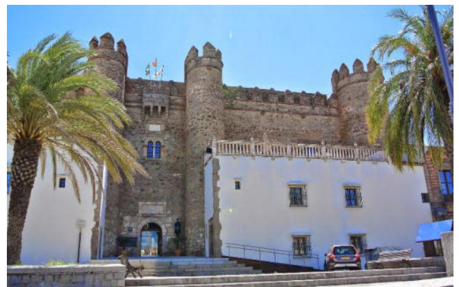
Alcázar von Zafra

Am Vormittag beginnt Ihre Reise auf der „Ruta de la Plata“ mit der Fahrt nach Zafra . Bei einem kurzen Rundgang durch das von Römern gegründete Städtchen besuchen Sie die Stiftskirche La Candelaria und blicken auf den festungsartigen Alcázar . Der ehemalige Palast der Herzöge von Feria beherbergt heute einen stilvollen Parador (Außenbesichtigung).