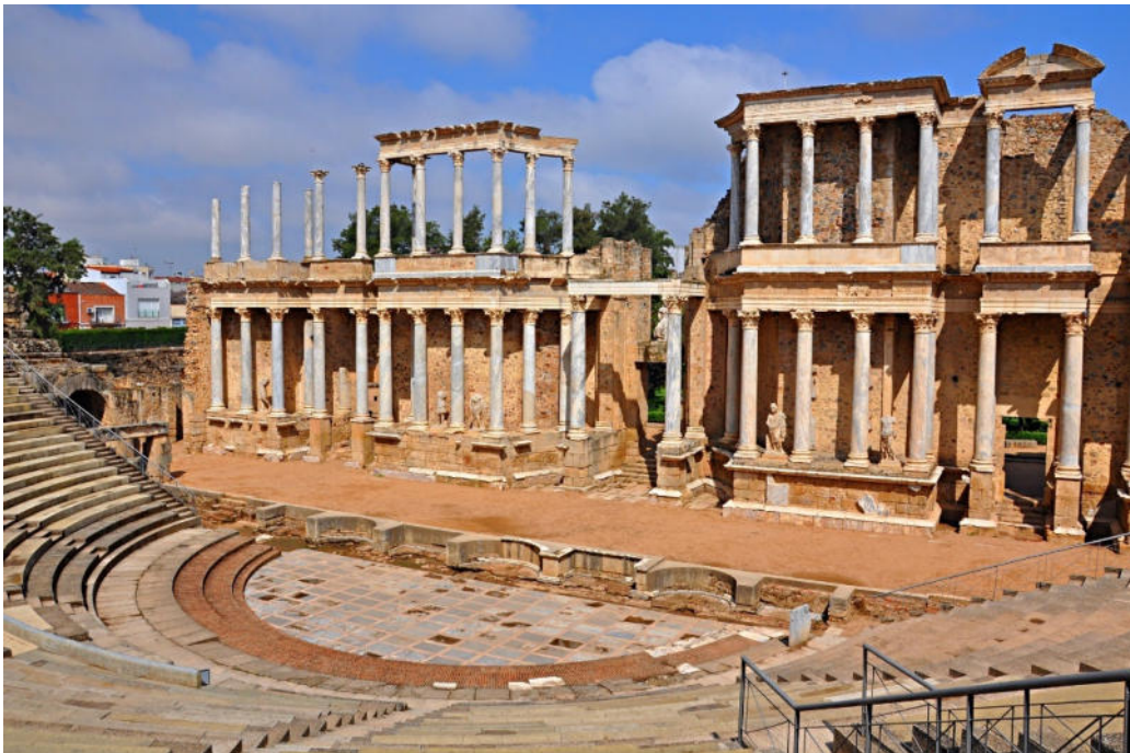
Römisches Theater in Mérida

Im Westen Spaniens verläuft einer der ältesten Handels- und Transportwege auf der Iberischen Halbinsel . Bereits im 2. Jh. v. Chr. planten und bauten die Römer eine durchgehend und später vollständig gepflasterte Verbindung, die von Sevilla in Andalusien durch die Extremadura nach Kastilien-Léon und weiter nach Asturien und Galicien führte. Im Mittelalter wurde sie zum Teil der Jakobswege , auf der die Pilger das Grab des Apostels Jakobus in Santiago de Compostela erreichten.