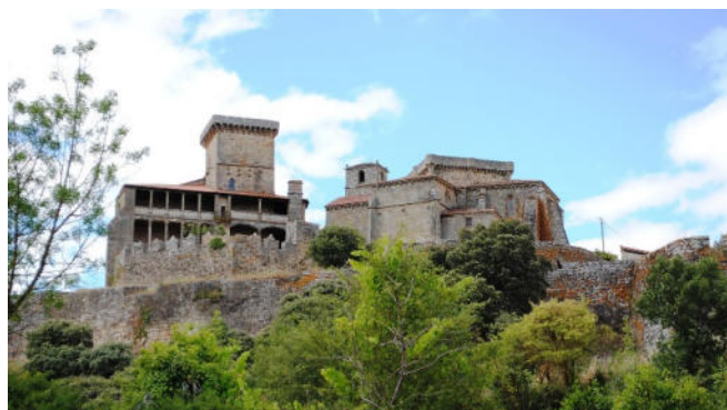
Castillo de Monterrei

Im nahegelegenen Parador von Verín, der in einem traditionellen galicischen Herrenhaus untergebracht ist, werden Sie zum Abendessen und zur Übernachtung erwartet. Genießen Sie die schönen Ausblicke auf die Landschaft, die Weinberge im Tal und die Burg.