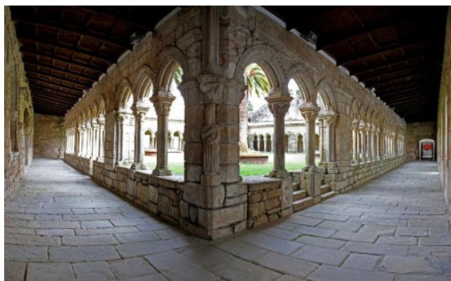
San Francisco in Ourense

Vom mittelalterlichen Kloster der Franziskaner ist im Wesentlichen nur noch der romanisch-gotische Kreuzgang erhalten geblieben. Ein Ort der Ruhe und Beschaulichkeit mit wunderschön gestalteten Kapitellen.