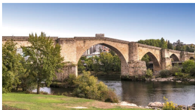
Romanische Brücke in Ourense

Erstes Ziel Ihrer heutigen Etappe ist die bereits von den Römern gegründete Provinzhauptstadt Ourense , zu deren bekanntesten Wahrzeichen die romanische Brücke über den Río Miño und die Kathedrale San Martín gehören. Ein herausragendes Beispiel romanischer Bauplastik ist der Pórtico del Paradiso , dessen Vorbild das Portal der Kathedrale von Santiago de Compostela war. Mit ihrem Sterngewölbe ist die Kuppel über der Vierung ein Element gotischer Architektur. Der Schnitzaltar im Chor stammt aus dem frühen 16. Jh. und wurde von einem flämischen Meister geschaffen.