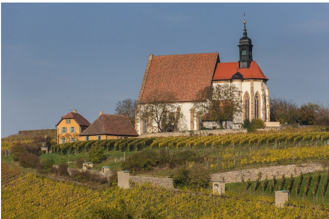
Maria im Weingarten

Am Vormittag Chorarbeit . Am Nachmittag führt ein Ausflug in die Volkacher Mainschleife, die zu den schönsten Flusslandschaften Frankens gehört. In engen Windungen schlängelt sich der Fluss durch die scheinbar endlosen Weinberge. Bei einer Schiffahrt genießen Sie herrliche Ausblicke auf die besten Weinlagen der Region und gleiten vorbei an romantischen Winzerdörfern .