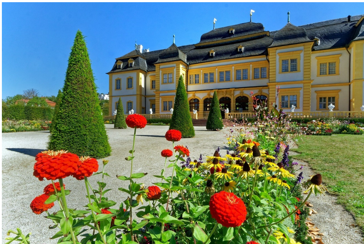
Schloss Veitshöchheim

Eingebettet zwischen Spessart, Rhön, Steigerwald und Taubertal liegt das Fränkische Weinland , eine alte Kulturlandschaft mit romantischen Winzerdörfern , beschaulichen Fachwerkstädten und der herrschaftlichen Residenzstadt Würzburg . Mehr als jede andere Epoche hat die Barockzeit die Region geprägt. Davon zeugen prachtvoll ausgestattete Kirchen , fürstliche Residenzen und üppig blühende Gärten .