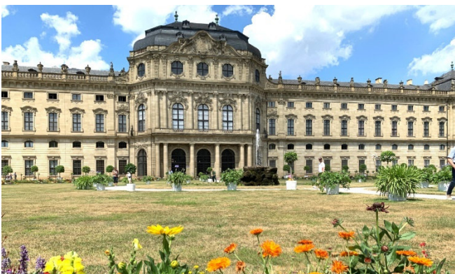
Würzburger Residenz

Am Vormittag Chorarbeit . Nach dem Mittagessen fahren Sie nach Würzburg und besuchen die Residenz , die sich die Würzburger Fürstbischöfe im 18. Jh. von Balthasar Neumann erbauen ließen. Die gesamte Anlage mit Residenzplatz und Hofgarten zählt zu den bedeutendsten Barockschlössern Europas und gehört zum UNESCO-Weltkulturerbe. Weltberühmt ist das von Tiepolo geschaffene Deckenfresko über dem imposanten Treppenhaus.