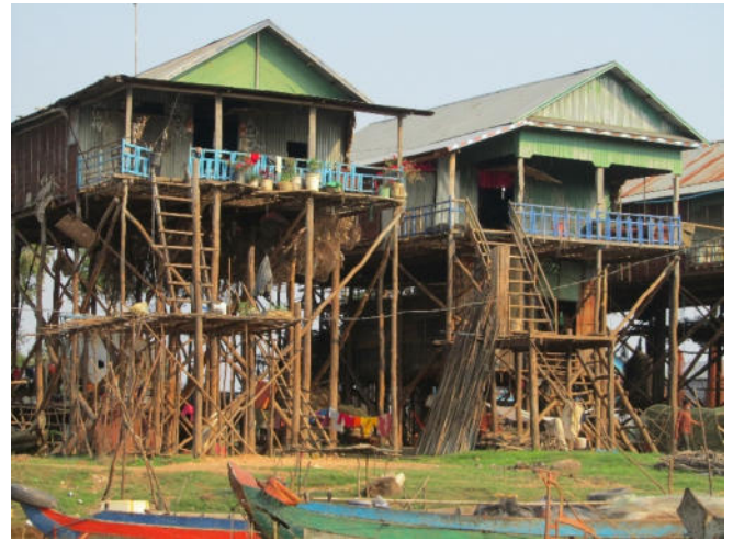
Kampong Phluck

Mit dem Boot fahren Sie über den gewaltigen Tonle Sap-See, dem größten See Südostasiens , ein außergewöhnliches Wassersystem! Während der Regenzeit kann er sich auf ein fünffaches seiner Größe ausdehnen.