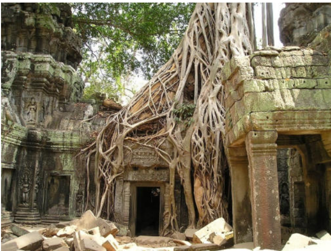
Magischer Tempel Ta Prohm

Der Tempel Preah Koh stammt aus dem Jahr 879 nach Christus und besteht aus sechs Ziegeltürmen. Der Bakong , der zweite Tempel der Roluosgruppe ist umgeben von 8 Ziegeltürmen mit Resten feiner Stuckdekoration. Ferner besuchen Sie den Lolei-Tempel . Ursprünglich erhob sich dieser auf einer künstlichen Insel im Indratataka-Becken. Seitdem dieses ausgetrocknet ist, erstrecken sich rund um den Tempel zahlreiche Reisfelder.