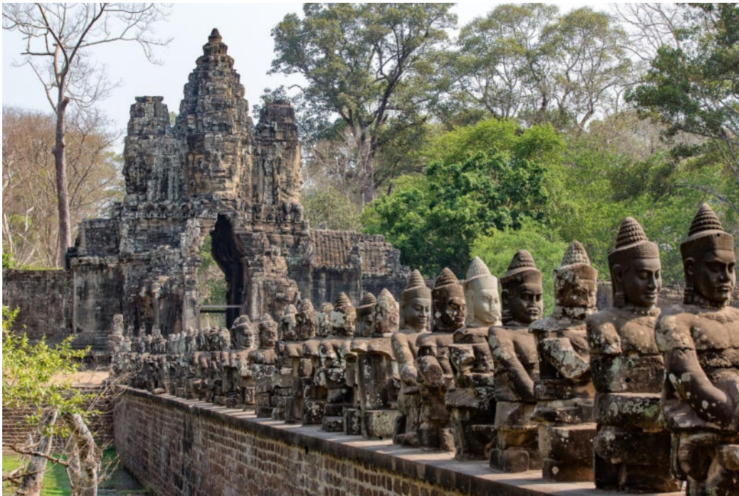
Angkor Thom

Die historischen Wurzeln Kambodschas liegen im Khmer-Königreich Kambuja. Zwischen dem 9. und 15. Jh. erlebte die Region ihre kulturelle Blütezeit, in der einzigartige Tempelanlagen entstanden. Dazu gehören u. a. das berühmte Angkor Wat , der größte Tempelkomplex der Welt, Banteay Srei und Roluos . Von der Geschichte weitgehend vergessen und von der Natur zurückerobert, versanken die einzigartigen Kunst- und Architekturschätze über Jahrhunderte in einen Dornröschenschlaf. Ein beeindruckendes Beispiel ist Ta Prohm , wo der Dschungel den Tempel überwuchert hat und eine einmalige Harmonie aus Natur und Architektur entstand. Nur wer dort war, kann die Magie dieses Ortes begreifen!