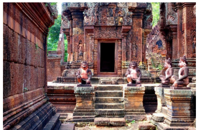
Banteay Srei

Gemeinsames Abendessen in einem Restaurant.