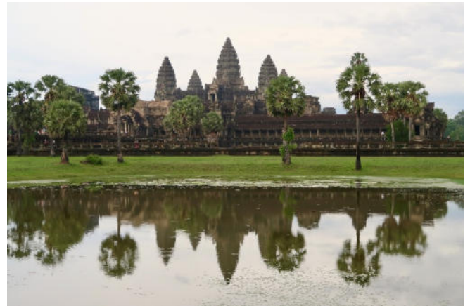
Angkor Wat

Am Vormittag steht der größte religiöse Park der Welt, das prächtige UNESCO-Weltkulturerbe Angkor Wat auf Ihrem Programm.