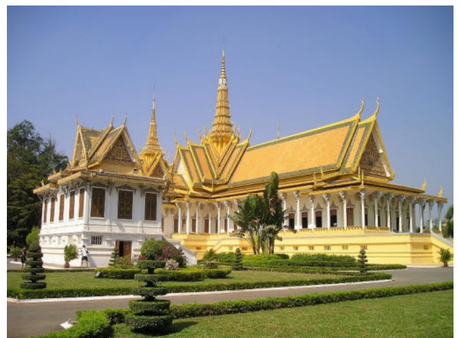
Königspalast in Phnom Penh

Rückfahrt nach Phnom Penh und gemeinsames Abendessen in einem Restaurant.