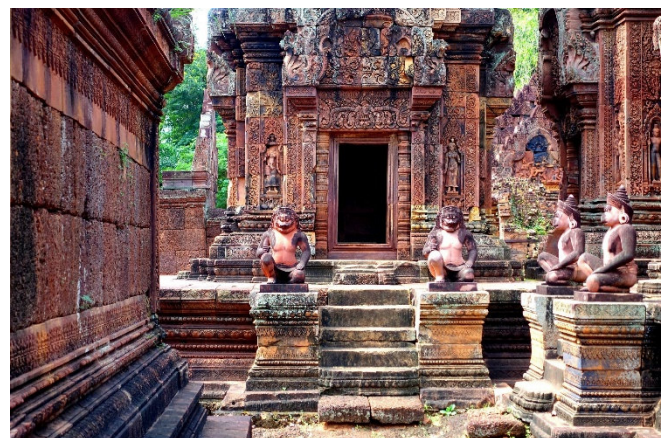
Banteay Srei

Gemeinsames Abendessen in einem Restaurant.