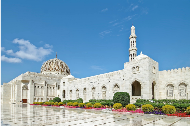
Sultan Qaboos Moschee in Maskat

Am frühen Morgen heißt Sie Ihre örtliche deutschsprachige Reiseleitung am Flughafen herzlich willkommen! Transfer zu Ihrem Hotel und Zimmerbezug.