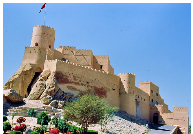
Restaurierte Festung Husn al-Him in Nakhl

Zimmerbezug im Hotel für 1 Nacht und gemeinsames Abschiedsabendessen im Hotelrestaurant, bei dem Sie die vielen Eindrücke dieser Reise noch einmal gemeinsam Revue passieren lassen können.