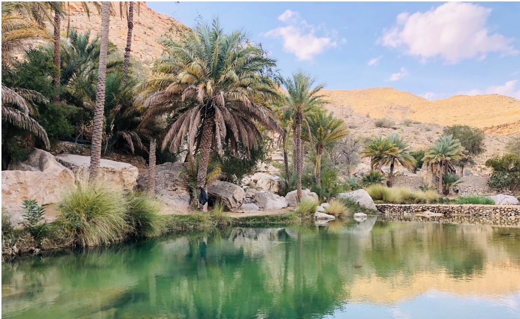
Wadi Bani Khalid

Ihre Reise führt Sie in den Oman, am östlichen Rand der Arabischen Halbinsel gelegen. Hier begegnen Ihnen wild zerklüftete Hochgebirge , beeindruckende Canyons sowie idyllische Oasen und weitläufige Plantagen – die kontrastreichen Landschaften bieten einzigartige Naturerlebnisse. Zahlreiche archäologische Zeugnisse gehören zum Weltkulturerbe der UNESCO : monumentale Lehmfestungen, sagenumwobene Häfen sowie Rastplätze an der Weihrauchstraße . Die heute noch vorhandenen Spuren der 5000-jährigen Seehandelstradition werden Sie beeindrucken!