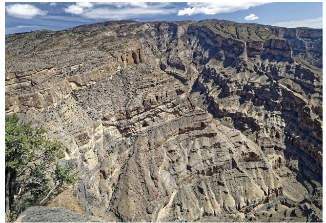
Jebel Shams

Eine kurze Fahrt bringt Sie an den Abgrund der Wadi Nakhar-Schlucht , des „omanischen Grand Canyons“. Die Schlucht des Wadis gräbt sich hier über 1000 m tief in das Gebirge. Der Blick in den Canyon ist absolut spektakulär. Genießen Sie die atemberaubende Aussicht, bevor Sie Ihr Hotel für 1 Nacht beziehen. Beim gemeinsamen Abendessen werden der heutige Ausflug und der Ausblick sicher Thema Nr. 1 sein!