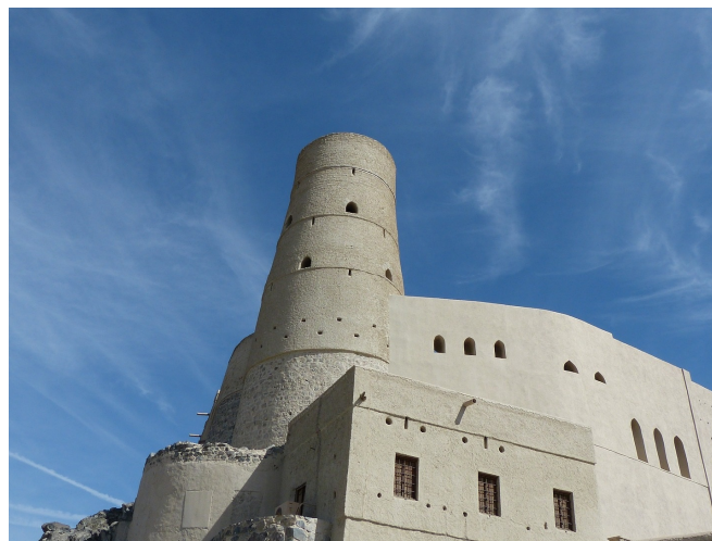
Hisn Tamah in Bahla

Nicht weit entfernt liegt das im 17. Jh. erbaute Schloss Jabrin , von dem gesagt wird, es sei das schönste im ganzen Oman. Es scheint beinahe so, als hätten alle Künstler und Architekten der damaligen Zeit zur Herrlichkeit und Pracht dieses Baus beigetragen. In einzelnen Teilen des Gebäudes befinden sich meisterhafte islamische Motive auf den Trägerbalken der Decke und in den Gewölben und Korridoren sind Gedichte eingraviert.