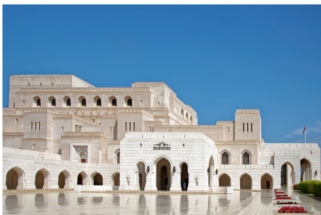
Royal Opera House Maskat

Anschließend Transfer zum Flughafen und Rückflug nach Frankfurt, wo Sie am Abend ankommen.