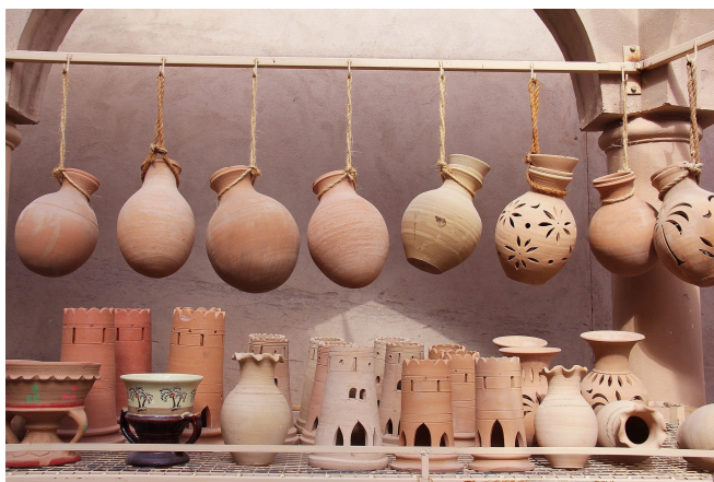
Waren im Souq