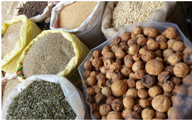
Gewürze im Souq von Nizwa

Bis zum gemeinsamen Abendessen im Hotel bleibt noch ein wenig Zeit für individuelle Erkundungen.