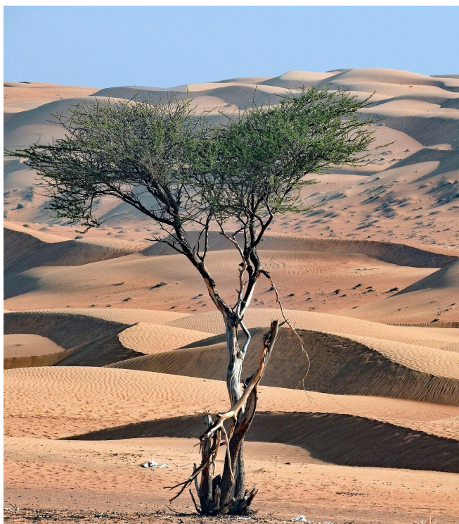
Wahiba Sands Wüste

Die Straße endet an einem Parkplatz. Hier haben Sie Gelegenheit zu einem kleinen Spaziergang bis zum Wadi. Es ist üppig grün bewachsen und in dem glas-klaaren, türkisgrün schimmernden Wasser tummeln sich zahlreiche kleine Fische. Mittagspause mit Lunchpaketen in dieser herrlichen Kulisse.