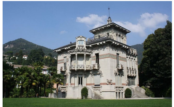
Villa Bernasconi in Cernobbio CCBYSA4.0 Dario Crespi at-wikimedia.commons

Zu Beginn fahren Sie in das Dorf Cernobbio , nahe der Schweizer Grenze. Hier besichtigen Sie mit der Villa Bernasconi ein wahres Kleinod des italienischen Jugendstils. Sie wurde Anfang des 20. Jh. erbaut und zählt zu den eindrucksvollsten Villen dieser Epoche in der Region. Mit geschwungenen Formen, floralen Dekorationen, detailreichen Ausgestaltungen und auch schmiedeeisernen Elementen schuf der Architekt ein wahres Meisterwerk , das sich durch die Nähe zum Comer See und die umliegende Landschaft perfekt in die Umgebung einfügt.