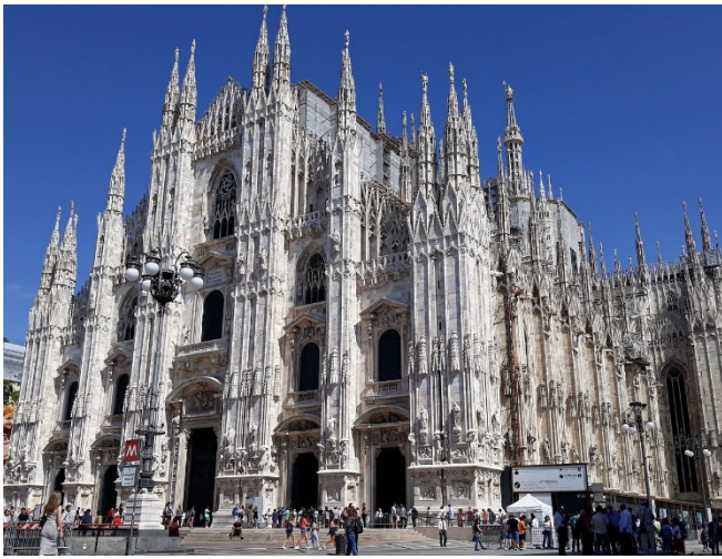
Dom zu Mailand

Sie sehen auf Ihrem Rundgang zwei weitere sehr bedeutende Kirchen, die beide die lange Geschichte und die religiöse Bedeutung der Stadt perfekt widerspiegeln.