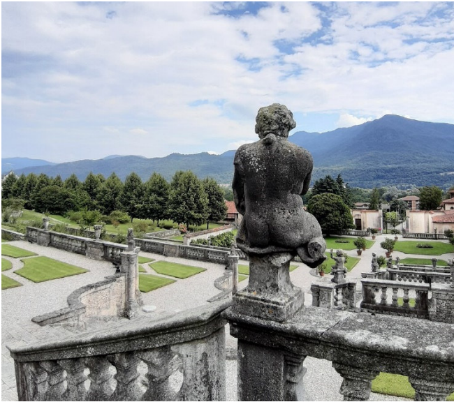
Villa della Porta Bozzolo

Vom Seeufer aus erreichen Sie nach einer kurzen Fahrt ins Landesinnere das historische Zentrum von Casalzuigno . Mit der prächtigen Adelsresidenz Villa della Porta Bozzolo aus dem 16. Jh. besichtigen Sie eines der bedeutendsten Zeugnisse des Barocks in dieser Region. Der imposante Garten zählt zu den harmonischsten Meisterwerken der Gartenbaukunst und grüner Architektur des Landes.