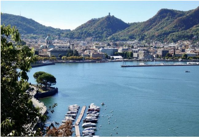
Como CCBYSA4.0 Uppa66 at-wikimedia.commons

Mit diesen herrlichen Eindrücken kehren Sie zum Hotel zurück und genießen das gemeinsame Abendessen.