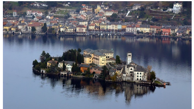
Insel San Giulio

Mit ihren engen, gepflasterten Gassen, historischen Gebäuden und der charmanten Piazza Motta zieht die kleine Stadt Orta San Giulio ihre Besucher in den Bann. Oberhalb des Ortes befindet sich der Sacro Monte di Orta , der ebenfalls zu den neun ausgezeichneten Sacri Monti Norditaliens gehört. Die Kapellen erzählen mit ihren Fresken und Skulpturen die Lebensgeschichte des Heiligen Franz von Assisi.