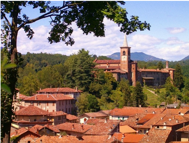
Castiglione Olona CCBYSA3.0 Idéfix wikicommons at-wikimedia.commons

Erstes Ziel Ihres heutigen Ausflugs ist das charmante kleine Dorf Castiglione Olona . Es liegt malerisch am Fuße der Alpen und ist bekannt für seine reiche Geschichte und atemberaubende Architektur. Eine der Hauptattraktionen ist die Stiftskirche Santi Stefano e Lorenzo , die für ihre wunderschönen Fresken, die von berühmten Künstlern der Renaissance geschaffen wurden, bekannt ist.