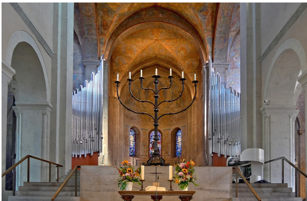
Chororgel im Braunschweiger Dom