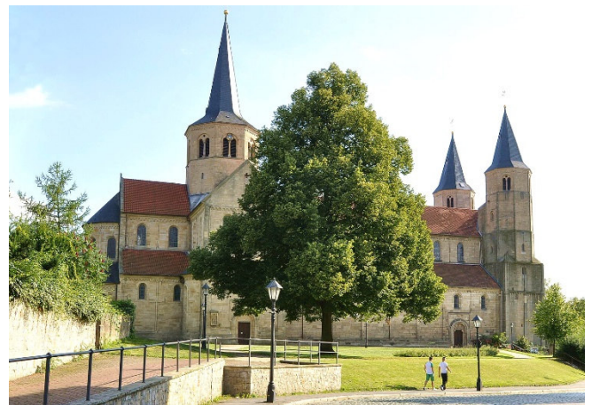
Basilika St. Godehard

Noch immer ist die Universitäts- und Bischofsstadt im Süden von Hannover ein Geheimtipp. Dabei blickt sie auf eine mehr als 1200-jährige Geschichte zurück und galt bis zum Ende des Zweiten Weltkriegs als eine der schönsten Städte Europas. Die damals fast vollständig zerstörte Altstadt mit ihren mittelalterlichen Kirchen wurde jedoch aufwändig rekonstruiert.