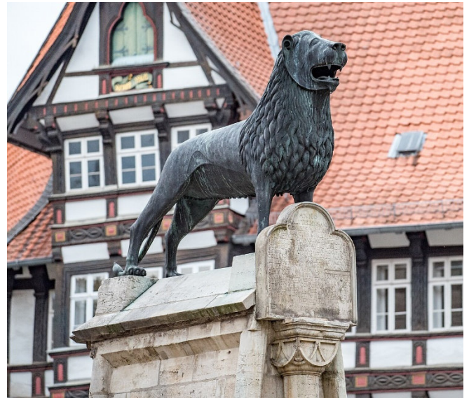
Braunschweiger Löwe

Als Herzog von Sachsen und Bayern machte Heinrich der Löwe seine Residenz Braunschweig im 12. Jh. zu einem europäischen Machtzentrum . Am Burgplatz steht auf einem Sockel vor der Burg Dankwarderode der Braunschweiger Löwe , das bekannteste Wahrzeichen der Stadt.