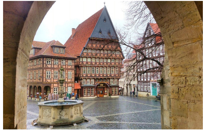
Marktplatz in Hildesheim

Am Abend erreichen Sie Ihren Standort am Marktplatz im Herzen von Hildesheim . Hinter den wieder aufgebauten Fassaden mehrerer Altstadt Häuser erwartet Sie ein modernes und komfortables Hotel. Nach dem Zimmerbezug für 3 Übernachtungen klingt der Tag mit einem gemeinsamen Abendessen aus.