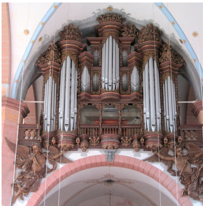
Orgel der Klosterkirche Lamspringe