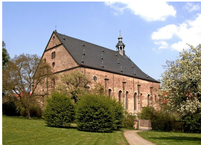
Klosterkirche Lamspringe

Am Morgen Abfahrt im modernen Reisebus in Köln (weitere Zustiege auf Anfrage). Vorbei an Paderborn und durch das Weserbergland erreichen Sie den Erholungsort Lamspringe an der Quelle der Lamme. Untrennbar verbunden mit der Geschichte des Ortes ist ein bereits im 9. Jh. gegründetes Benediktinerinnenkloster , das seine Blütezeit im Mittelalter erlebte. Zu den ältesten Gebäuden der ehemaligen Abtei gehört die schlichte aus Bruchsteinen erbaute Klosterkirche St. Hadrian und Dionysius aus den Jahren 1685 bis 1693. Damals lebten und wirkten hier aus England vertriebene Benediktinermönche.