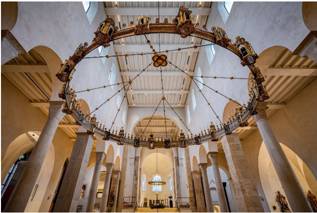
Hildesheimer Dom

Mit dem Hildesheimer Dom besichtigen Sie ein viel bestauntes UNESCO-Weltkulturerbe. Zu den einmaligen Kunstschätzen der erst vor wenigen Jahren umfangreich restaurierten Kirche gehören die Bernwardstür und die Christussäule . Die biblischen Darstellungen aus der Zeit Bernwards zeugen eindrucksvoll vom Glauben und der Schaffenskraft im Mittelalter. Im Kreuzgang der Bischofskirche wächst der „ Tausendjährige Rosenstock “.