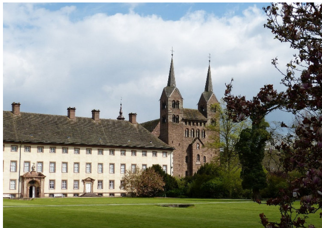
Schloss Corvey CC0 pixabay

Als ständige Residenz der Herzöge zu Braunschweig und Lüneburg erlebte Wolfenbüttel seit dem späten Mittelalter eine wirtschaftliche und kulturelle Blüte. Die besten Baumeister ihrer Zeit entwarfen zwischen Harz und Heide die erste nach Plan gebaute Residenzstadt Deutschlands . In engem Verhältnis zur Residenz steht die zu Beginn des 17. Jh.s. gebaute Hauptkirche Beatae Mariae Virginis , der erste protestantische Großkirchenbau der Welt. Auf besondere Weise vereint die Marienkirche Stilelemente der Gotik, der Renaissance und des Barocks.