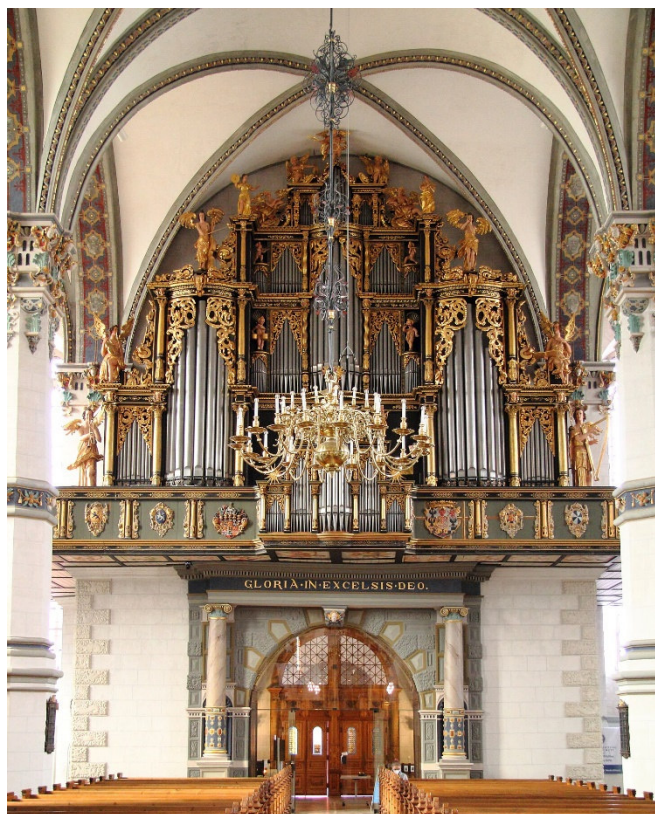
Orgel in Wolfenbüttel

Die Datenschutzerklärungen für die Interessenten an unseren Reiseangeboten sowie für unsere Kunden und Teilnehmer finden Sie im Internet unter https://www.conti-reisen.de/datenschutz .