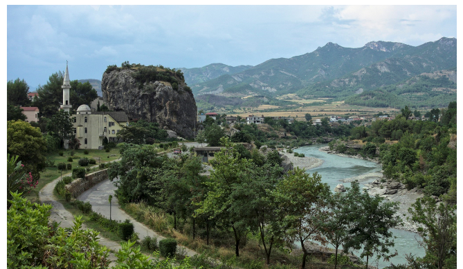
Guri i Qytetit in Përmet

Sie besichtigen den Uhrturm von Korça, der im osmanischen Stil originalgetreu rekonstruiert wurde. Direkt daneben befindet sich die Mirahor-Moschee , die älteste Einkuppelmoschee des Landes.