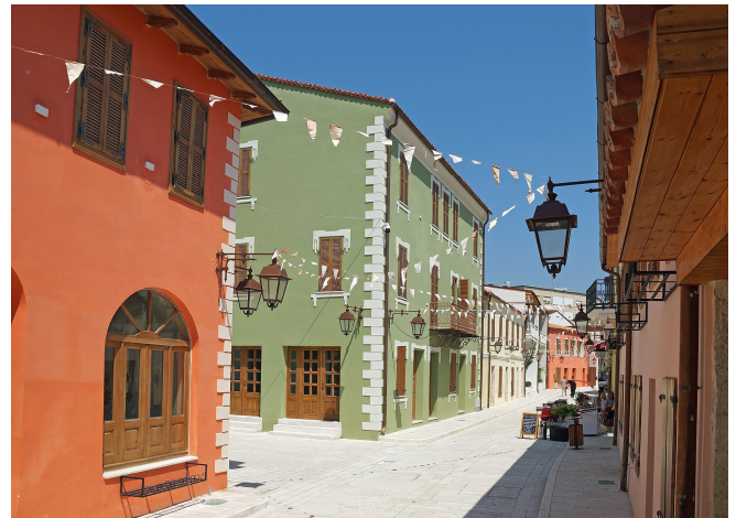
Altstadt von Vlorë

Bevor Sie weiter zum Llogara-Nationalpark fahren, besuchen Sie das alteingesessene Familienunternehmen Gjikondi in dem kleinen malerischen Dorf Qeparo. Die Region ist bekannt für ihre traditionelle Herstellung hochwertigen Olivenöls . Genau wie diese Tradition sind auch die „ Kalinjot “- Olivenbäume bereits Jahrhunderte alt. Diese wachsen in der Umgebung an der Küste des Ionischen Meeres. Das Klima hier mit rund 300 Sonnentagen im Jahr und die frische Bergluft tragen wesentlich zur goldgrünen Farbe des Öls bei und verleihen dem hochwertigen Olivenöl seinen unverkennbaren pikanten Geschmack. Bei der Besichtigung erfahren Sie mehr über die Olivenölherstellung und dürfen dieses auch verkosten.