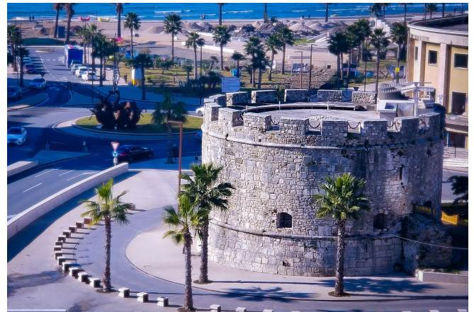
Venezianischer Turm in Durres

Weiter sehen Sie den venezianischen Turm, Wahrzeichen der Stadt und Teil des ehemaligen Schlosses von Durres. Dieses wurde im byzantinischen Zeitalter errichtet und von den späteren Herrschern, wie den Venezianern und Osmanen, erweitert. Zum Abschluss der Besichtigung spazieren Sie entlang der byzantinischen Stadtmauer , von der einige Teile noch sehr gut erhalten sind. Besonders im Bereich des Hafens, wird die strategische Bedeutung in der Antike und im Mittelalter, wie auch die Widerstandsfähigkeit der Stadt spürbar.