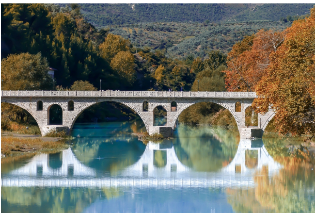
Bogenbrücke in Berat

Anschließend geht es zur Roten Moschee , von der heute nur noch einige Reste zu sehen sind und weiter in das türkische Mangalemi-Viertel in der Unterstadt. Verwinkelte, steile Gassen schlängeln sich durch das Viertel hinunter bis zum Fluss Osumi. Auf der anderen Seite befindet sich das noch recht ursprüngliche Viertel Gorica. Verbunden sind die beiden Viertel durch eine steinerne Bogenbrücke aus dem Jahr 1780, ein markantes Baudenkmal, das eine alte Holzbrücke ersetzte.