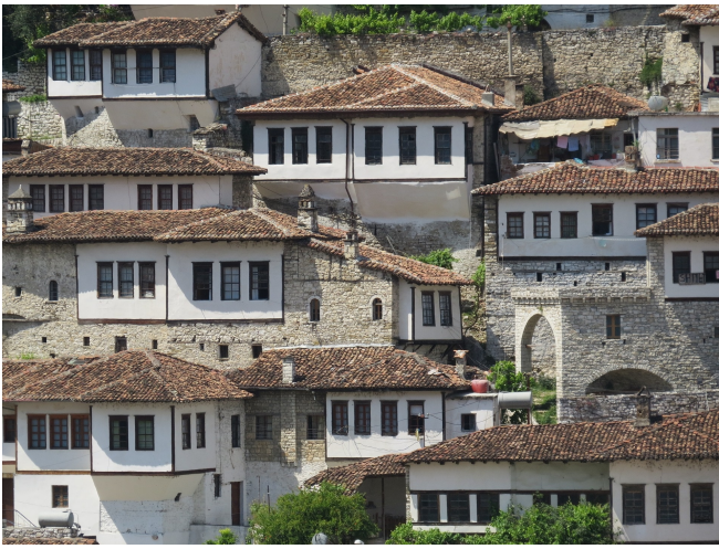
Berat CC0 Pixabay