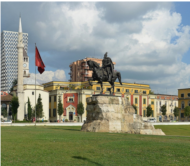
Skanderbegplatz in Tirana

Sie kommen zunächst zum Skanderbeg-Platz . Dies ist der zentrale Platz der Stadt und zugleich des Landes, hier befinden sich neben den Ministerien alle wichtigen Gebäude und Sehenswürdigkeiten. Das dominierende Denkmal in der Mitte erinnert an den Nationalhelden des Landes , an Fürst Skanderbeg, dem es gelang im 15. Jh. die Osmanen auf ihrem Vormarsch Richtung Balkan aufzuhalten.