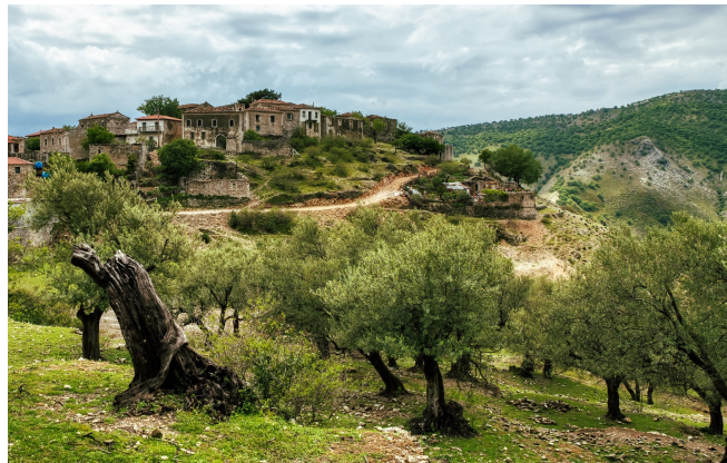
Olivenbäume vor Qeparo

Einzigartige Natur erwartet Sie anschließend im Llogara-Nationalpark. Dieser erstreckt sich auf einer Fläche von etwa 1000 Hektar und ist dicht mit Pinien und Sträuchern bewachsen. Auf einer Höhe zwischen 500 und 2000 Metern erstreckt er sich auf der Nordseite des Llogara-Passes. Neben Füchsen, Wölfen und Wildkatzen leben hier auch noch einige Steinadler und Uhus. Bei einem Stopp haben Sie etwas Zeit zu einem kleinen Spaziergang oder die Natur bei einem Kaffee zu genießen.