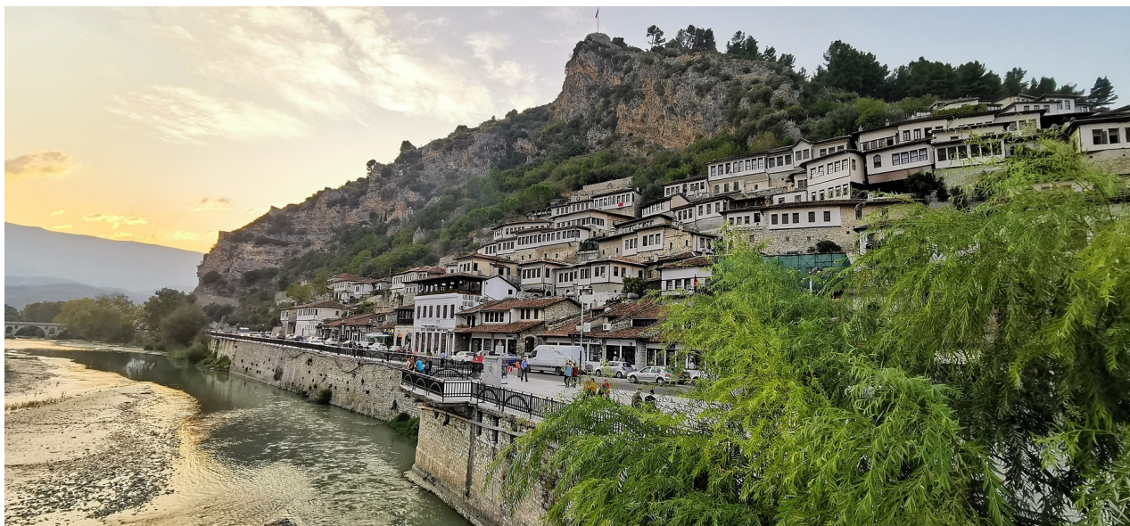
Berat „Stadt der Tausend Fenster“

In einer kontrastreichen Landschaft zwischen Bergen und Meer erzählen großartige Kulturschätze die wechselvolle Geschichte eines der ältesten Völker Europas, das seine Besucher mit herzlicher Gastfreundlichkeit empfängt.