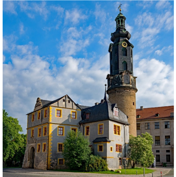
Residenzschloss in Weimar

Nach der Mittagspause in der charmanten Altstadt besichtigen Sie das Residenzschloss , das nach dem Aussterben der Altenburger Linie im Jahr 1672 in den Besitz des Herzogtums Sachsen-Gotha-Altenburg gelangte. Von 1826 bis 1918 war Sachsen-Altenburg wieder ein eigenständiges Herzogtum.