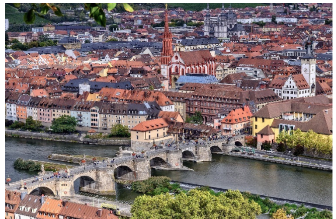
Panorama von Würzburg

Zum Abschluss besuchen Sie den Hofgarten, dessen symmetrische Gestaltung und kunstvoll angelegte Blumenbeete Sie in die Welt der höfischen Gartenkunst eintauchen lassen. Während Sie durch die gepflegten Wege spazieren, bietet sich Ihnen ein schöner Blick auf die eindrucksvolle Fassade der Residenz.