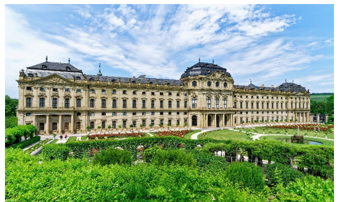
Würzburger Residenz

Ein Spaziergang führt durch die Altstadt zum Dom St. Kilian , dem viertgrößten romanischen Kirchenbau in Deutschland. Ein Meisterwerk barocker Architektur ist die von Balthasar Neumann entworfene Schönbornkapelle . Vorbei am Rathaus erreichen Sie mit der Alten Mainbrücke eines der bekanntesten Wahrzeichen Würzburgs. Genießen Sie bei einem Glas „Brückenschoppen“ die wunderbare Aussicht auf den Fluss und die Festung Marienberg (fakultativ)! Rückfahrt nach Köln mit Ankunft am Abend.