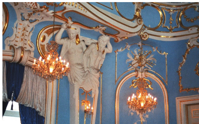
Schloss Sondershausen

Der Blaue Saal ist mit seinen hohen Decken und Wänden, die in einem edlen Blau gehalten sind, einmalig. Goldene Kronleuchter hängen von der Decke, während kunstvolle weiße Stuckarbeiten die Wände und Decke zieren. Das Achteckhaus im Schlosspark beherbergte ein hölzernes Pferdekarsell, das als Teil der höfischen Vergnügungen diente.