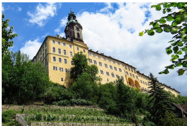
Heidecksburg in Rudolstadt

Der mittelalterliche Wohnturm gehört zu den ältesten Teilen des Schlosses und an diesen schließen sich die Renaissance trakte an, die im 16. Jh. hinzugefügt wurden. Der barocke Ausbau erfolgte ab dem 17. Jh., als die Familie Schwarzburg in den Reichsfürstenstand erhoben wurde. Das Schloss diente nicht nur als Wohnsitz, sondern auch als Verwaltungssitz und symbolisierte die Macht und den Einfluss der Familie in der Region.