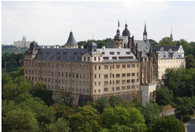
Schloss Altenburg

Die heutige Schlossanlage ist das Ergebnis von Um- und Ausbauten, die im Laufe der Jahrhunderte vorgenommen wurden. Besonders im 17. und 19. Jh. erhielt das Schloss sein heutiges barockes und klassizistisches Erscheinungsbild .