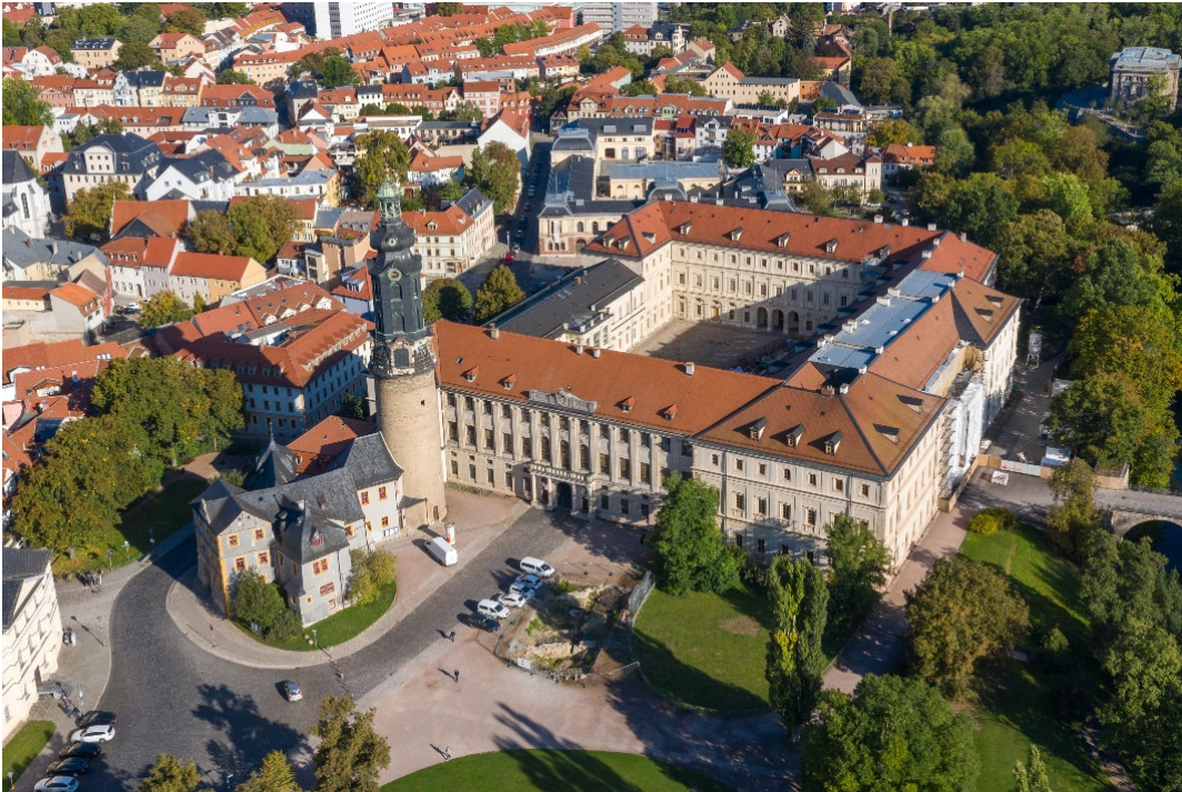
Weimarer Stadtschloss

Vom Mittelalter bis zu seinem Untergang 1806 bestand das Heilige Römische Reich Deutscher Nation aus vielen Dynastien, deren zahlreiche Residenzen zu kulturellen und politischen Zentren ihrer Region wurden. Mächtige Schlossanlagen aus verschiedenen Epochen zeugen eindrucksvoll vom Status der ehemaligen Reichsfürsten. Nirgendwo ist das so deutlich zu sehen wie in Thüringen . Mit Blick auf ihre kulturelle Einmaligkeit sind die Residenzlandschaften seit 2021 auf dem Weg zum UNESCO-Weltkulturerbe . Grund genug für Prof. Dr. Schock-Werner, sich mit Ihnen auf die Reise zu machen, um das Thema gemeinsam zu vertiefen.