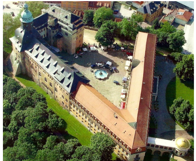
Schloss Sondershausen

Rückfahrt nach Weimar und gemeinsames Abendessen im Hotel.