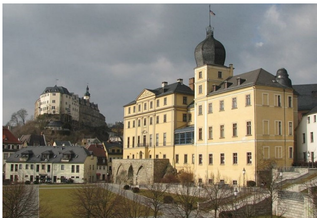
Schlösser in Greiz

Nach einer individuellen Mittagspause geht es weiter nach Greiz, wo Sie das Obere und Untere Schloss erkunden. Das Obere Schloss thront auf einem Hügel und stammt aus dem späten 12. Jh. Es diente lange Zeit als Verwaltungssitz des Hauses Reuß , während das Untere Schloss im klassizistischen Stil nach einem Stadtbrand 1802 wiederaufgebaut wurde.