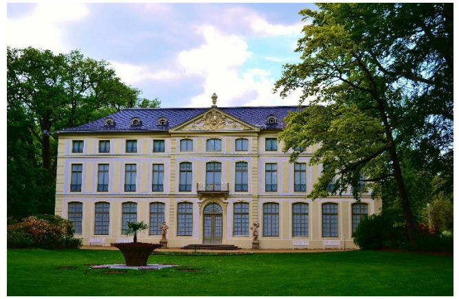
Sommerpalais in Greiz CC0 at pixabay

Sie besichtigen das Sommerpalais in Greiz, eines der bekanntesten Kulturdenkmäler in Thüringen. Erbaut in den Jahren 1768 bis 1770 diente die Anlage den Fürsten von Reuß-Greiz als Sommerresidenz. Das Palais liegt malerisch im Greizer Park, einem englischen Landschaftsgarten , der um das Palais herum angelegt wurde. Der schlichte, aber elegante Bau im Stil des Barocks und des frühen Klassizismus zeichnet sich durch klare Formen und eine symmetrische Gestaltung aus. Ursprünglich als Ort der Entspannung und des Rückzugs für die fürstliche Familie konzipiert, spiegelt es die Vorliebe des 18. Jh. für Natur und Gartenkunst wider.