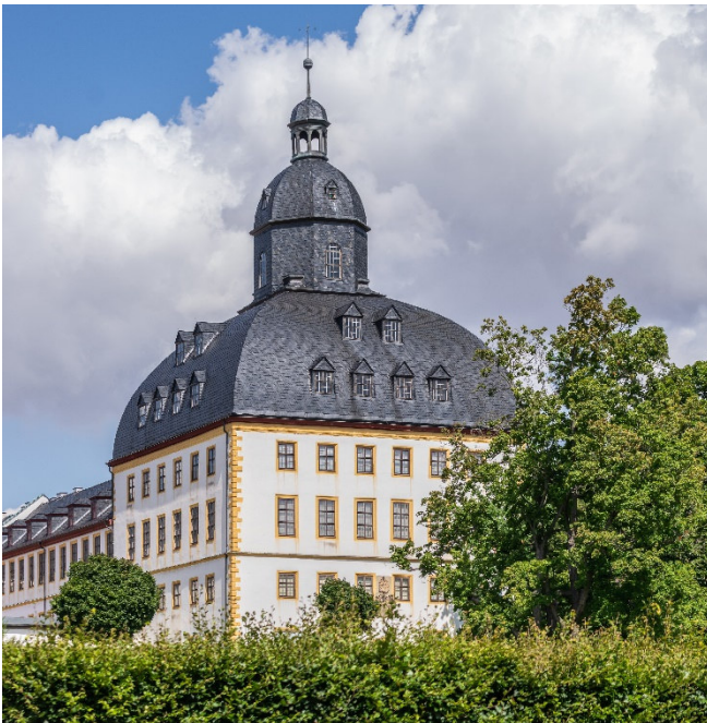
Schloss Friedenstein

Weiterfahrt zu Ihrem Hotel im Zentrum von Weimar und Zimmerbezug für 4 Übernachtungen. Bei einem gemeinsamen Abendessen klingt der Tag aus.