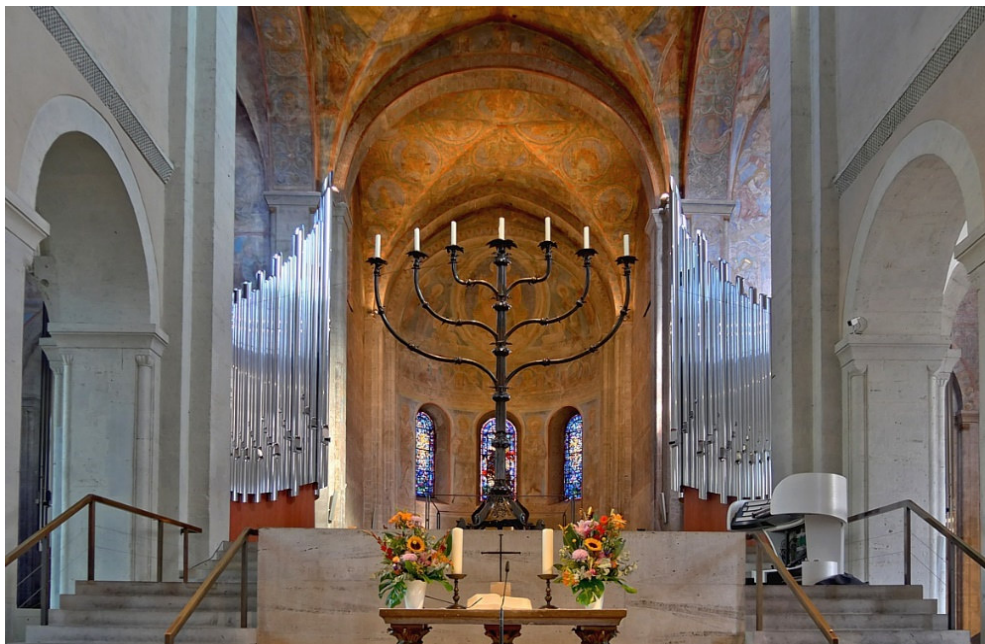
Chororgel im Braunschweiger Dom