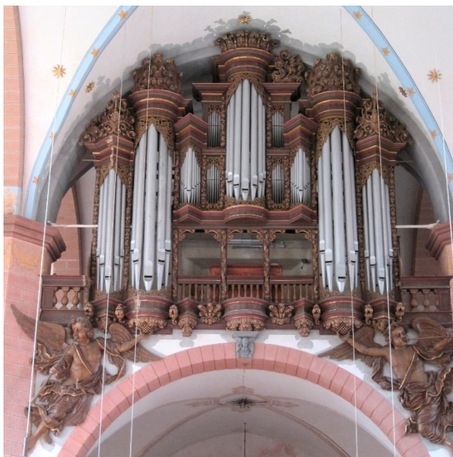
Orgel der Klosterkirche Lamspringe

Bemerkenswert ist die barocke Ausstattung der dreischiffigen Hallenkirche , die fast vollständig erhalten geblieben ist. Hinter einem historischen Orgelprospekt verbirgt sich die von der Firma Philipp Furtwängler & Söhne im Jahr 1876 neu gebaute Kirchenorgel mit drei Manualen und 43 Registern. Bei einer konzertanten Vorführung wird Wolfgang Siegenbrink das Instrument für Sie erklingen lassen.