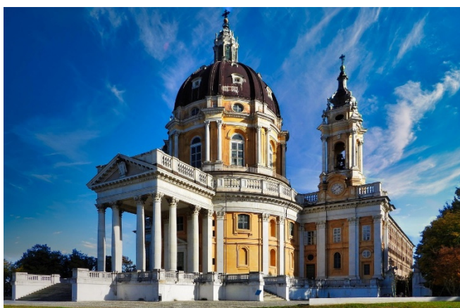
Basilika di Superga

Dann heißt es Abschied nehmen. Fahrt zum Flughafen und Rückflug nach Frankfurt.