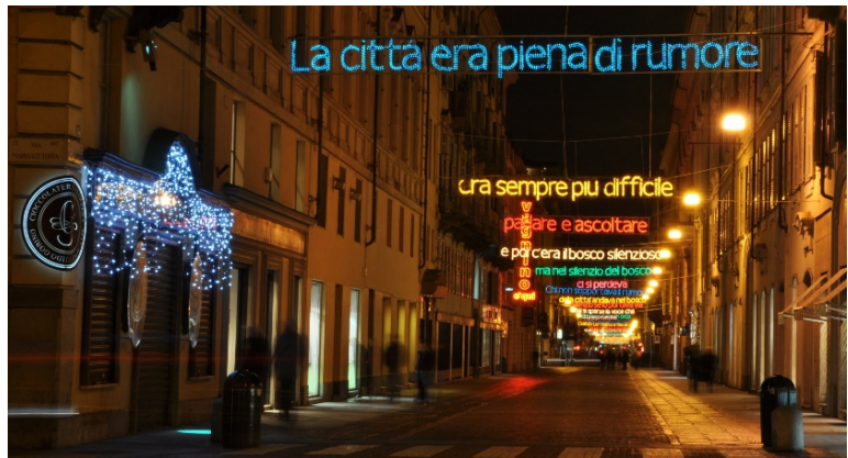
Luci d'Artista CCBY marco benna at-flickr, Turin CCBYSA3.0 Hpnx9420 at-wikimedia.commons, Luci d'Artista 1 CCBY Giorgio Brida at-flickr

Erleben Sie Turin zur Vorweihnachtszeit, wenn die „ Luci d'Artista “ die Stadt am Po in ein kunstvolles Lichtermeer verwandeln. Sobald es dunkel wird, lassen die aufwändigen Installationen und Projektionen internationaler zeitgenössischer Künstler die berühmten Arkadengänge und altherwürdigen Gemäuer von Kirchen und Palästen hell erstrahlen.