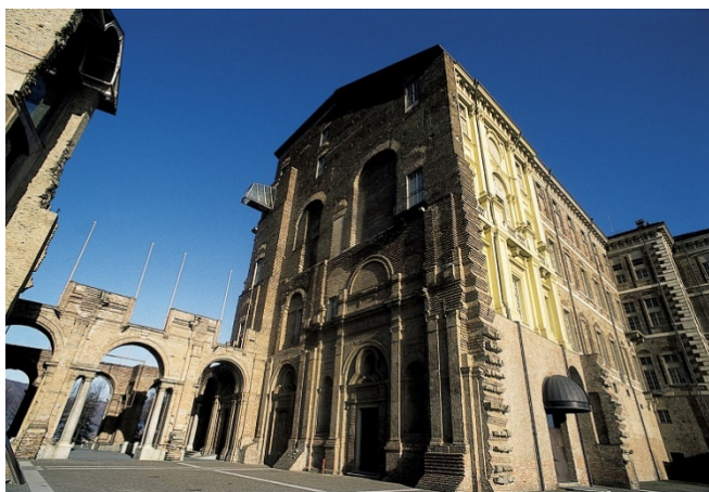
Castello di Rivoli