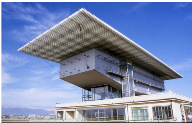
Pinacoteca Agnelli