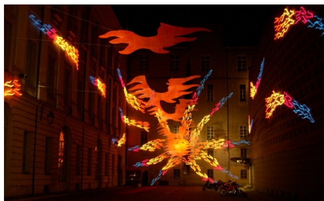
Luci d'Artista – Sonnenwind

Zwischen den Besichtigungen besuchen Sie das wunderschöne historische Café im Palazzo . Hier erwartet Sie eine Merenda Reale , eine wahrlich „königliche Zwischenmahlzeit“. Das Ritual, bei dem in stilvollem Ambiente heiße Schokolade zusammen mit unwiderstehlichem Gebäck gereicht wird, orientiert sich an der Tradition des Savoyer Hofes ab dem 18. Jh.