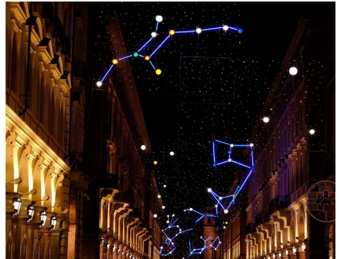
Luci d'Artista – Planeten

Bei einem gemeinsamen Abendessen in einem Restaurant lassen Sie die Eindrücke des ersten Tages nachwirken.