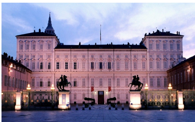
Palazzo Reale

Turin war Hauptstadt des Hauses Savoyen vom 12. bis zum 19. Jh. und der Königliche Palast bezeugt dessen hochadeligen Lebensstil.