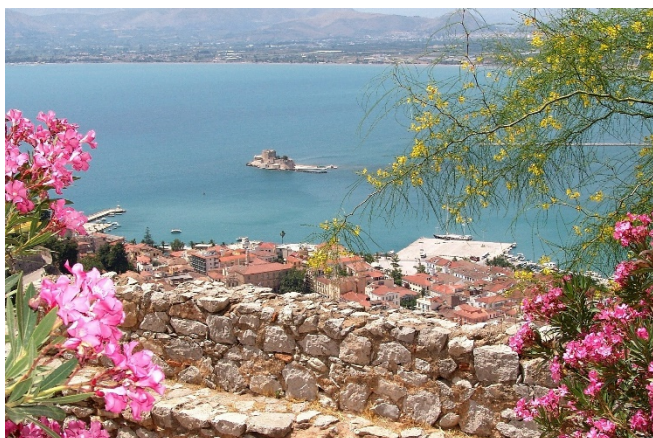
Nauplia Hafen

Nach der ausführlichen Besichtigung fahren Sie weiter in das malerisch gelegene Hafenstädtchen Nauplia am Golf von Argolis. Genießen Sie das besondere Flair der Stadt bei einem Bummel durch die Gassen und entlang des Hafens. Zahlreiche Tavernen und gemütliche Cafés bieten griechische Gastlichkeit und laden zum Verweilen ein.