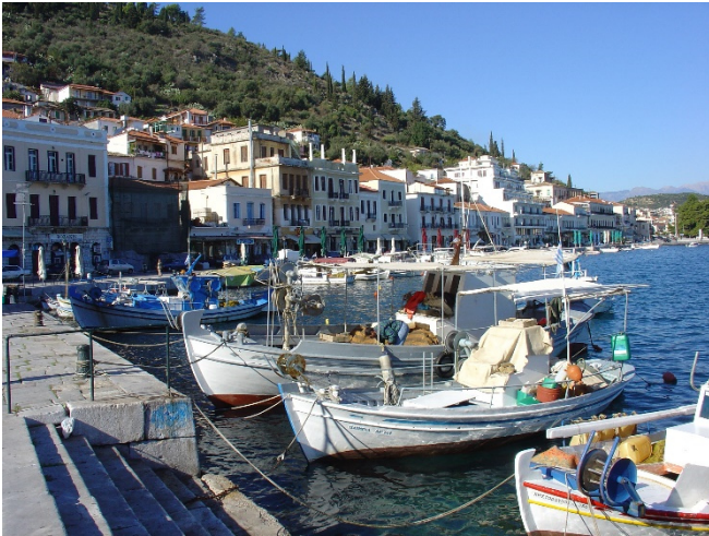
Hafen von Gythio

Flug von Köln über München nach Athen (andere Abflughäfen auf Anfrage). Begrüßung durch Ihre örtliche Reiseleitung und Fahrt zu Ihrem Hotel in Gythio. Das beschauliche Hafenstädtchen im Süden des Peloponnes ist Ihr Standort für die ersten 2 Übernachtungen. Bei einem gemeinsamen Abendessen in einer Taverne direkt am Hafen lernen Sie die Teilnehmer Ihrer Reisegruppe kennen.