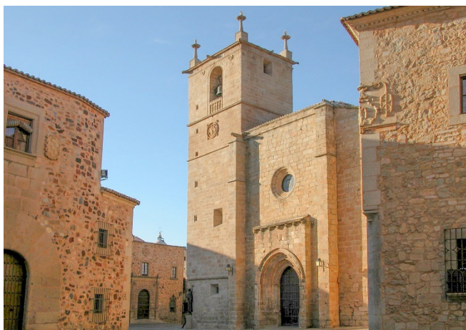
Konkathedrale Santa María

Ein Spaziergang durch die gepflasterten Gassen der von einer Stadtmauer umgebenen Altstadt gleicht einer Zeitreise ins Mittelalter und die Renaissance . Zahlreiche Villen und Adelspaläste erzählen eindrucksvoll aus der Geschichte der Stadt auf deren Kirchtürmen Störche nisten. Etwas versteckt entdecken Sie die von außen schmucklose Konkathedrale Santa María , die ein schönes Sterngewölbe und ein sehenswertes Altarretabel besitzt.