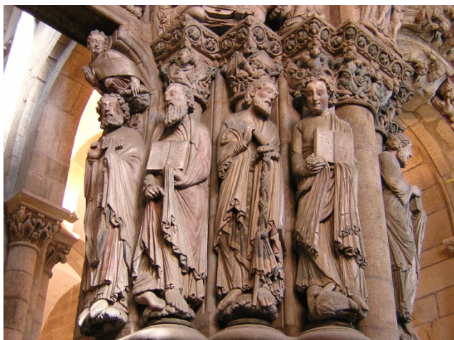
Apostel am Pórtico de la Gloria

Um 12:00 Uhr bietet sich die Gelegenheit zur Teilnahme an der täglich stattfindenden Pilgermesse. Individuelle Mittagspause.