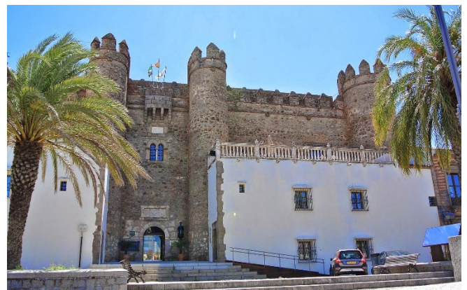
Alcázar von Zafra

Am Vormittag beginnt Ihre Reise auf der „Ruta de la Plata“ mit der Fahrt nach Zafra . Bei einem kurzen Rundgang durch das von Römern gegründete Städtchen besuchen Sie die Stiftskirche La Candelaria und blicken auf den festungsartigen Alcázar . Der ehemalige Palast der Herzöge von Feria beherbergt heute einen stilvollen Parador (Außenbesichtigung).