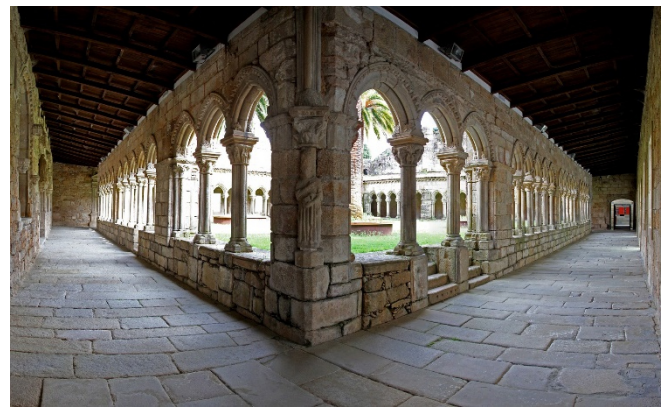
San Francisco in Ourense

Vom mittelalterlichen Kloster der Franziskaner ist im Wesentlichen nur noch der romanisch-gotische Kreuzgang erhalten geblieben. Ein Ort der Ruhe und Beschaulichkeit mit wunderschön gestalteten Kapitellen.