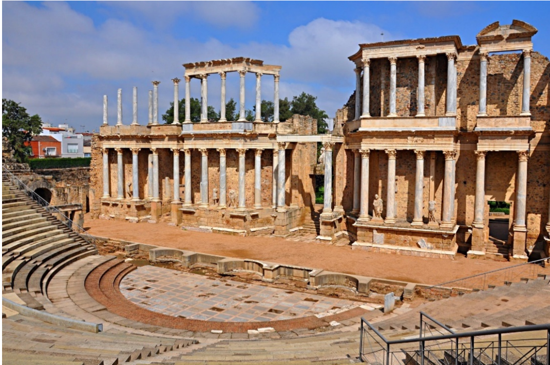
Römisches Theater in Mérida

Im Westen Spaniens verläuft einer der ältesten Handels- und Transportwege auf der Iberischen Halbinsel . Bereits im 2. Jh. v. Chr. planten und bauten die Römer eine durchgehend und später vollständig gepflasterte Verbindung, die von Sevilla in Andalusien durch die Extremadura nach Kastilien-León und weiter nach Asturien und Galicien führte. Im Mittelalter wurde sie zum Teil der Jakobswege , auf der die Pilger das Grab des Apostels Jakobus in Santiago de Compostela erreichten.