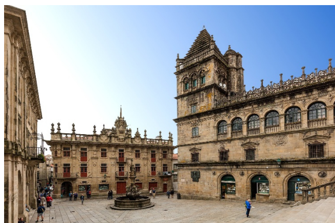
Plaza de las Platerías

Nach einem gemeinsamen Abschiedsabendessen in einem ausgesuchten Restaurant bietet sich die Gelegenheit zu einem abendlichen Spaziergang durch die Altstadt mit Blick auf die beleuchtete Fassade der Kathedrale.