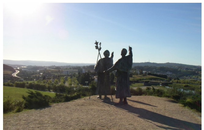
Monte do Gozo

Vorbei an Lavacolla, wo sich die Pilger des Mittelalters aus Liebe zum Apostel Jakobus den gesamten Körper wuschen, fahren Sie zum Monte do Gozo , dem „ Berg der Freude “. Wie Generationen vor Ihnen erblicken Sie von hier zum ersten Mal die Türme der Kathedrale von Santiago de Compostela!