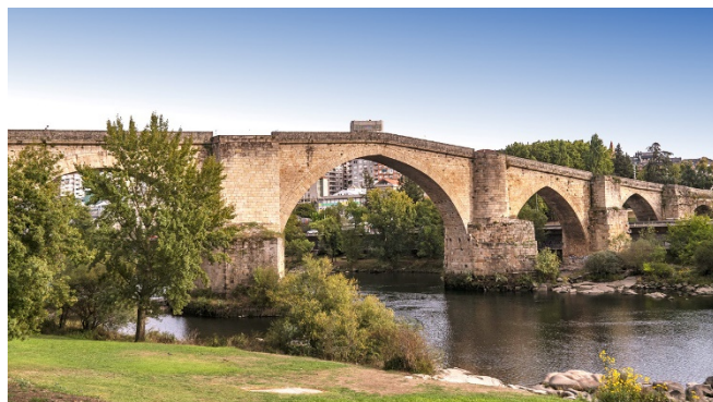
Romanische Brücke in Ourense

Erstes Ziel Ihrer heutigen Etappe ist die bereits von den Römern gegründete Provinzhauptstadt Ourense , zu deren bekanntesten Wahrzeichen die romanische Brücke über den Río Miño und die Kathedrale San Martín gehören. Ein herausragendes Beispiel romanischer Bauplastik ist der Pórtico del Paradiso , dessen Vorbild das Portal der Kathedrale von Santiago de Compostela war. Mit ihrem Sterngewölbe ist die Kuppel über der Vierung ein Element gotischer Architektur. Der Schnitzaltar im Chor stammt aus dem frühen 16. Jh. und wurde von einem flämischen Meister geschaffen.