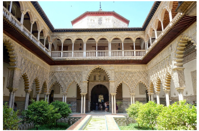
Königlicher Alcázar

Danach besuchen Sie den Königlichen Alcázar . Der maurische Palast wurde nach der Reconquista zur Residenz der christlichen Könige. Ein Ort der Harmonie und Beschaulichkeit sind die liebevoll gepflegten Palastgärten .