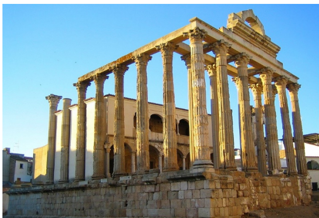
Tempel der Diana in Mérida

Bei einem gemeinsamen Stadtrundgang erkunden Sie am Nachmittag das historische Zentrum von Mérida. Die Stadt auf der dünn besiedelten Hochebene der Extremadura gehörte in der Antike zu den kulturell und politisch bedeutendsten Zentren des Römischen Reiches und war größte römische Stadt auf der Iberischen Halbinsel. Mit dem römischen Theater und den Überresten des Amphitheaters besichtigen Sie zwei eindrucksvolle Monumente aus dieser Epoche. Der Sammlungen des Nationalmuseums für römische Kunst runden Ihre Eindrücke ab.