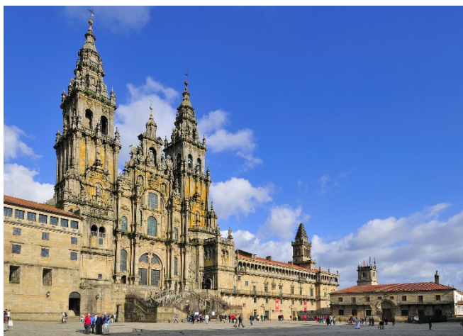
Kathedrale von Santiago de Compostela CCBY2.0 Yosika at-flickr