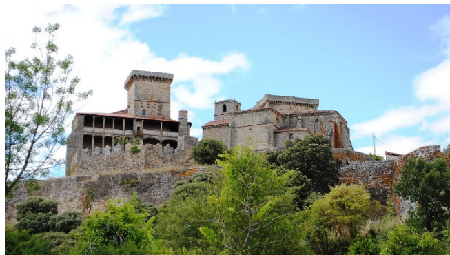
Castillo de Monterrei

Im nahegelegenen Parador von Verín, der in einem traditionellen galicischen Herrenhaus untergebracht ist, werden Sie zum Abendessen und zur Übernachtung erwartet. Genießen Sie die schönen Ausblicke auf die Landschaft, die Weinberge im Tal und die Burg.