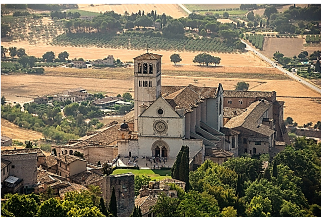
Blick auf die Franziskus-Basilika in Assisi

Mit der großartigen Franziskus-Basilika besichtigen Sie nicht nur ein zentrales Pilgerziel Italiens, sondern auch den Ort, an dem – der Überlieferung nach – Franziskus auf eigenen Wunsch beigesetzt werden wollte. Die steinerne Urne mit seinen Reliquien wird in der Krypta der Unterkirche aufbewahrt.