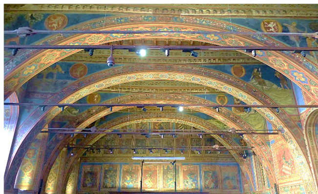
Sala dei Notari im Palazzo dei Priori

Als bedeutende Handelsstadt bot Perugia im Mittelalter die Möglichkeit, verschiedene Währungen zu tauschen .