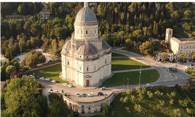
Santa Maria della Consolazione

Der gotische Dom aus dem 12. Jh. , der über einem römischen Apollo-Tempel errichtet wurde, beeindruckt besonders durch die wunderschöne zentrale Rosette an seiner Fassade und das prachtvolle Hauptportal mit ornamentalen Akanthusblättern.