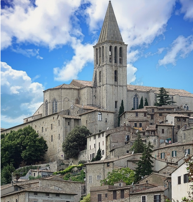
Blick auf Todi

Zum Abschluss Ihres Vormittags in Orvieto führt Sie ein Spaziergang zum Palazzo del Popolo (Außenbesichtigung).