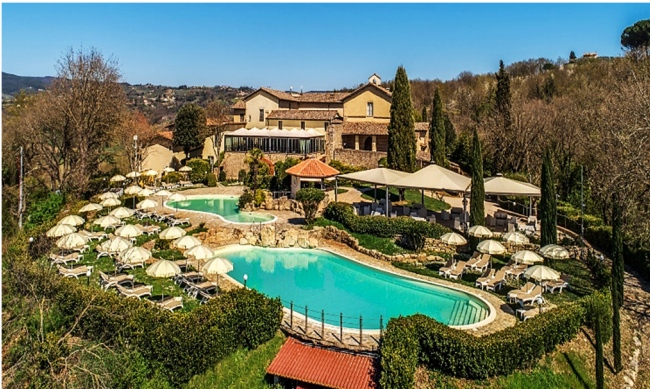
Abbazia Collemedio

Nach dem Zimmerbezug für die kommenden 6 Nächte haben Sie Gelegenheit, Ihr außergewöhnliches Hotel zu entdecken. Das einstige Kloster erwartet Sie in herrlicher Lage auf einem Hügel mit Blick auf die idyllische Landschaft der Umgebung. Ein perfekter Ort für Erholung und Entspannung inmitten der traumhaften Natur Umbriens. Der erste Tag klingt mit einem gemeinsamen Abendessen im Hotel aus.