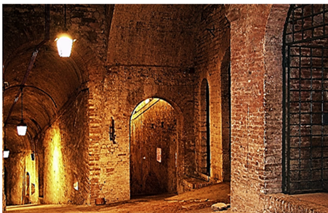
Festung Rocca Paolina in Perugia

Ein Bummel über den Corso Vanucci führt Sie anschließend zur Piazza Grande im Herzen der Stadt. Dort sehen Sie mit dem mittelalterlichen Brunnen, der Fontana Maggiore eine der bedeutendsten Sehenswürdigkeiten Perugias.