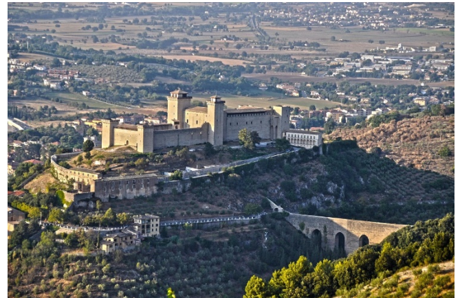
Spoleto mit der Brücke der Türme

Von der Aussichtsterrasse vor der Kirche San Pietro haben Sie einen herrlichen Blick auf die Brücke der Türme , einem 80 Meter hohen Aquädukt.