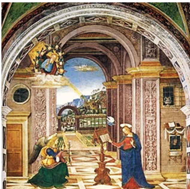
Fresko in der Kirche Santa Maria Maggiore