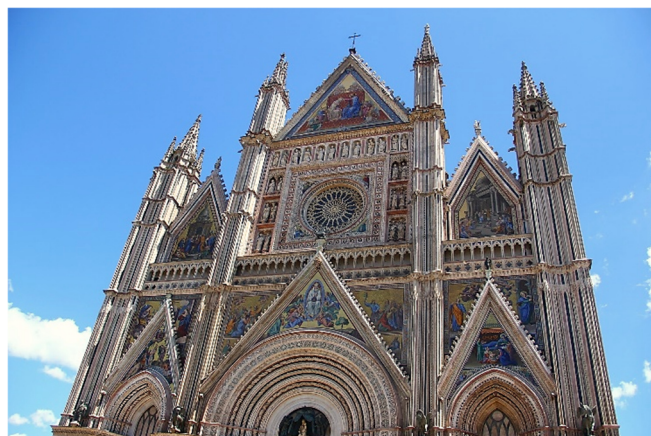
Fassade des Doms zu Orvieto

Nach dem Frühstück starten Sie zur Erkundung des südlichen Teils Umbriens. Die erhaben auf einem Tuffsteinplateau gelegene Stadt Orvieto wurde aufgrund ihrer strategisch günstigen Lage wahrscheinlich schon von den Etruskern gegründet .