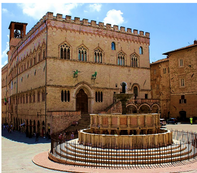
Piazza Grande in Perugia

Nicht weit davon entfernt befindet sich die Kathedrale San Lorenzo . Mit seiner eher schmucklosen Fassade hinterlässt der Dom trotz der fast acht Jahrhunderte währenden Bau- und Umbauzeit den Eindruck, unvollendet geblieben zu sein. Umso sehenswerter ist die Hallenkirche im Inneren mit ihrer reichen Ausstattung .