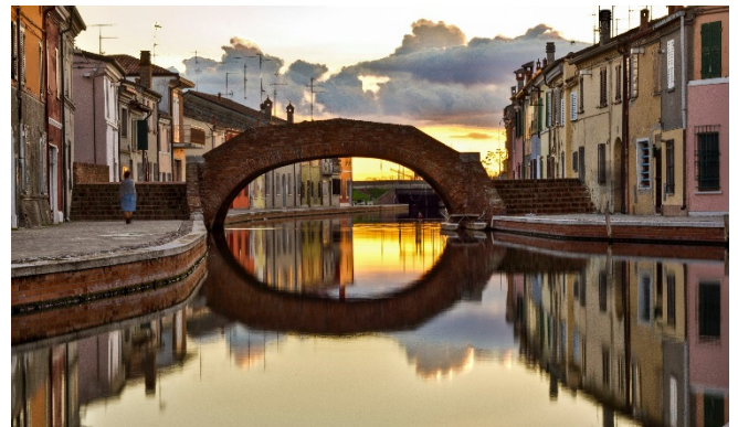
Brücke in Comacchio

Danach erwartet Sie die Basilika Sant'Apollinare in Classe mit ihrem typisch zylinderförmigen Glockenturm, eine der wichtigsten frühchristlichen Kirchen Ravennas. Der Name ‚Classis‘ bedeutet Flotte und erinnert noch heute an die einstige Rolle als bedeutender Militärhafen . An der rechten Wand der Basilika erinnert eine Inschrift an Bischof Apollinare , der das Christentum in Ravenna entscheidend vorantrieb.