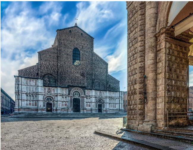
Basilica di San Petronio

Ausgangspunkt Ihrer Besichtigung ist die Piazza Malpighi mit dem Apsisbau der Franziskanerkirche. Ein Spaziergang führt Sie zur Piazza Maggiore , einem der beeindruckendsten Plätze Italiens. Er wird umrahmt von prächtigen mittelalterlichen Palazzi wie dem Palazzo Comunale und dem Palazzo di Re Enzo (Außenbesichtigungen). Auf der Piazza Maggiore sehen Sie außerdem den Neptunsbrunnen, ein Renaissance-Denkmal aus dem 16. Jh., das von Giambologna gestaltet wurde. In der Nähe befinden sich die Geschlechtertürme Asinelli und Garisenda , zwei mittelalterliche Wohntürme einflussreicher Familien. Besuch der Basilika San Petronio mit der von Giovanni da Modena ausgemalten Bolognini-Kapelle. Gelegenheit zu einer individuellen Mittagspause.