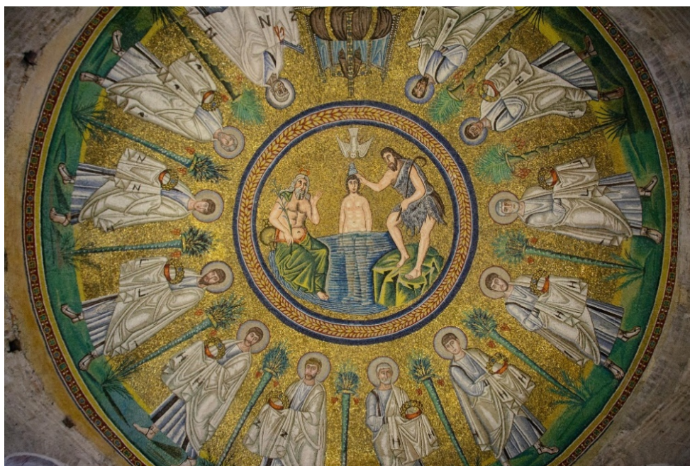
Mosaik in der arianischen Taufkapelle

In keiner Stadt lässt sich der Epochenwechsel von der Antike zum Mittelalter so anschaulich nachvollziehen wie im norditalienischen Ravenna. Nachdem die Stadt im 5. Jahrhundert mehr als 70 Jahre den weströmischen Kaisern als Residenz diente, folgten ihnen König Odoaker und der Gote Theoderich der Große . Die vom byzantinischen Baustil geprägten, mit glänzenden Mosaiken geschmückten Kirchen der Stadt zählen zu den schönsten Beispielen frühchristlicher Architektur in Italien und gehören zum UNESCO-Weltkulturerbe .