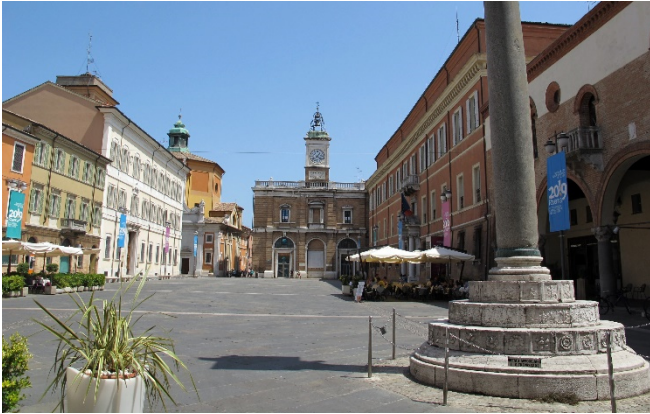
Piazza del Popolo

Zimmerbezug für 4 Übernachtungen und gemeinsames Abendessen im Hotel.