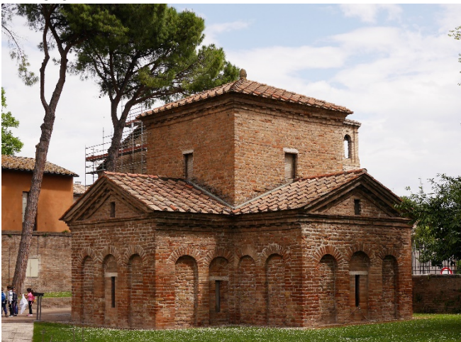
Mausoleum der Galla Placidia