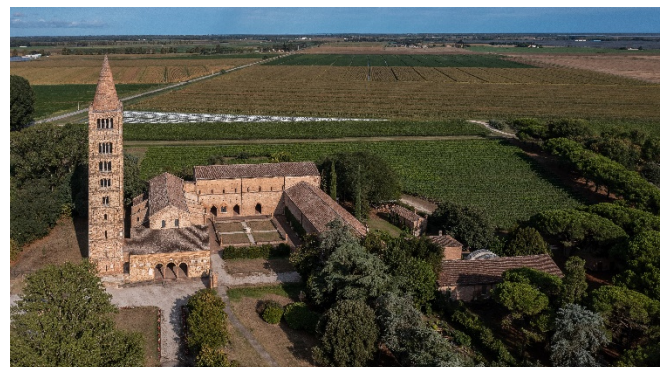
Abtei von Pomposa

Rückfahrt nach Ravenna und gemeinsames Abschiedsabendessen in einem ausgewählten Restaurant.