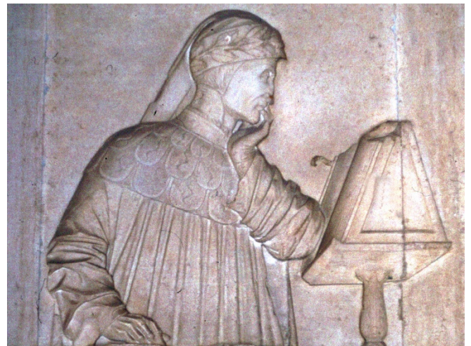
Grabstein von Dantes Grab

Besichtigung des Erzbischöflichen Museums von Ravenna , das sich im Palais des Erzbischofs nahe Dom und Baptisterium befindet. Hier werden Mosaikfragmente, religiöse Gewänder sowie Skulpturen und Reliefs gezeigt. Die Erzbischöfliche Kapelle mit Mosaiken aus dem 6. Jh. gehört ebenfalls zum Museum.