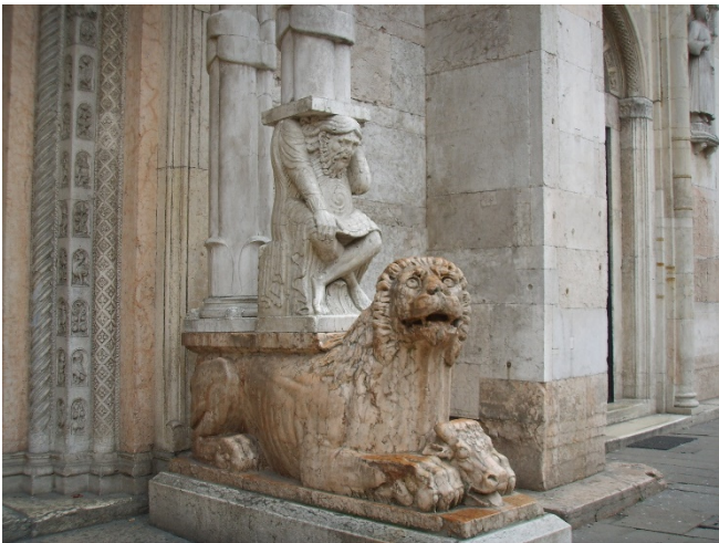
Skulpturen am Dom zu Ferrara

Spaziergang durch die historischen mittelalterlichen Straßen zum Dom zu Ferrara , der im lombardischen Übergangsstil zwischen Romanik und Gotik errichtet wurde.