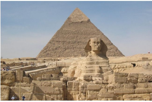
Sphinx und Cheops-Pyramide CC0 pixabay

Am Nachmittag fahren Sie zurück ins Nildelta und erreichen am Abend Ihr Hotel in Gizeh. Nach dem Zimmerbezug für 3 Übernachtungen klingt der Tag mit einem gemeinsamen Abendessen im Hotel aus.