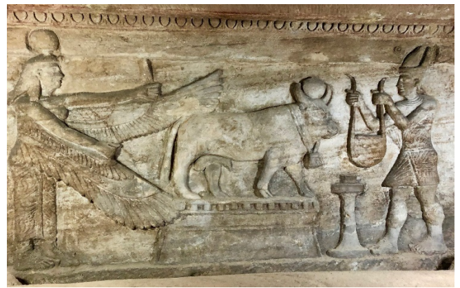
Katakomben von Kom el-Schukafa

Erstes Ziel Ihrer Stadtbesichtigungen ist die am Hafen liegende Qaitbay-Zitadelle , die im 15. Jahrhundert auf den Ruinen des antiken Leuchtturms von Pharos erbaut wurde. Mit einer Höhe von mehr als 120 m galt er als eines sieben Weltwunder der Antike. Vom Dach der imposanten Festung bietet sich ein wunderbarer Panoramablick.