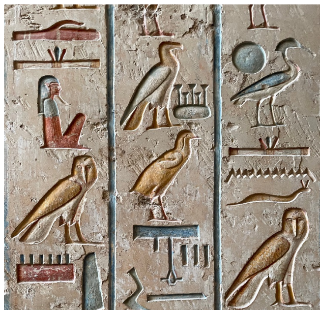
Hieroglyphen CC0 pixabay

Alt-Kairo CCBYSA4.0 Djehouty at-wikimedia.commons Statue Ramses II. CCBYSA4.0 Holger Uwe Schmitt at-wikimedia.commons Qaitbay-Zitadelle CC0 pixabay