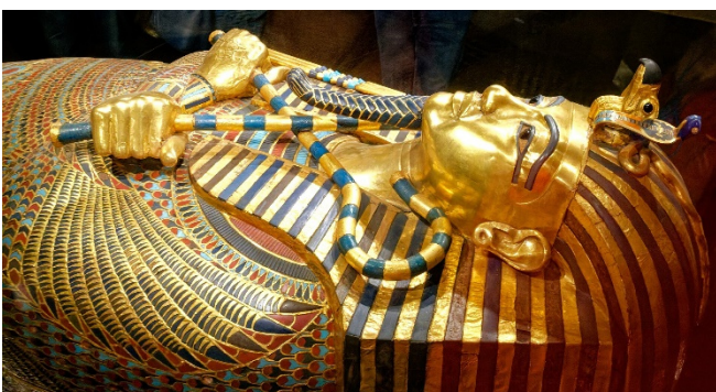
Sarkophag des Tutanchamun