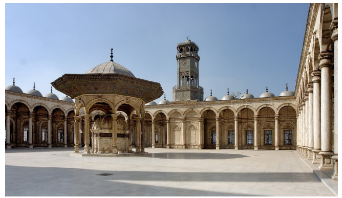
Innenhof der Muhammad-Ali-Moschee

Weithin sichtbar oberhalb des Stadtzentrums erhebt sich auf einer Anhöhe die Zitadelle von Saladin . Von der Festungsanlage, deren ältesten Teile aus dem 12. Jh. stammen, bietet sich ein herrlicher Panoramablick. Im Inneren der wehrhaften Anlage befindet sich die Muhammad-Ali-Moschee mit ihren zwei markanten Minaretten, die zu den bekanntesten Wahrzeichen Kairos gehören. Vom arkadengesäumten Innenhof betreten Sie den Gebetsraum, dessen Wände mit Alabaster verkleidet sind.