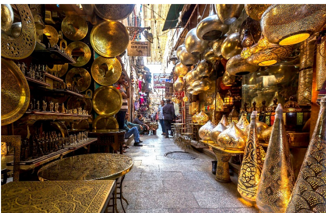
Khan el-Khalili-Basar

Anschließend bummeln Sie durch den farnefrohen Khan el-Khalili-Basar . Der traditionelle Handelsmarkt wurde bereits im 14. Jh. gegründet und bietet eine Fülle verschiedenster Waren.