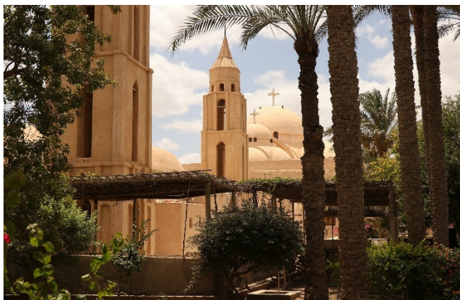
Kloster des hl. Makarios

Am Abend Ankunft in Alexandria und Zimmerbezug für 2 Übernachtungen. Gemeinsames Abendessen im Hotel.