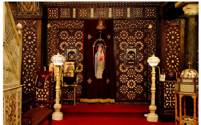
Hängende Kirche

Zum Abendessen werden Sie in einem traditionellen Restaurant erwartet. Freuen Sie sich auf die Vielfalt der orientalischen Küche!