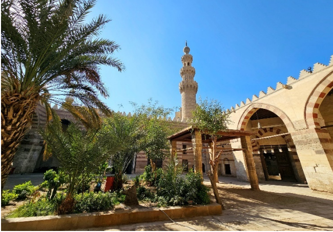
Islamisches Kairo

Gemeinsamer Flug mit Eurowings von Düsseldorf nach Kairo mit Ankunft am frühen Abend (andere Abflughäfen auf Anfrage). Nachdem die Einreiseformalitäten erledigt sind, begrüßt Sie Ihre örtliche Reiseleitung und begleitet Sie auf dem Transfer zu Ihrem Hotel im Zentrum von Kairo. Nach dem Zimmerbezug für 2 Übernachtungen klingt der Tag mit einem gemeinsamen Abendessen im Hotel aus.