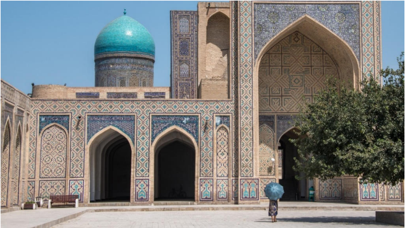
Kalyan-Moschee in Buchara