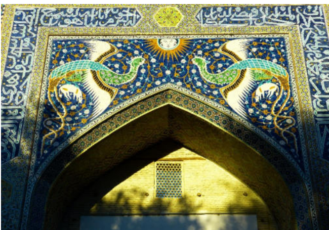
Medrese Nadir-Divan-Begi

Lassen Sie sich faszinieren von der Pracht und Anordnung der blau und türkis gekachelten Medrese Kukeldasch , dem ältesten Gebäude am Labi Chaus, der Medrese Nadir-Divan-Begi und der Chanaka Nadir-Divan-Begi , einer ehemaligen Pilgerunterkunft. Im Anschluss haben Sie Gelegenheit, sich mit einem der bekanntesten Puppenspieler Bucharas in seiner Marionetten-Manufaktur zu unterhalten.