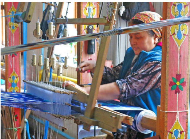
Seidenverarbeitung in Margilan

Der heutige Tag steht ganz im Zeichen der Seide . Das Klima der Region bietet die idealen Voraussetzungen für die Zucht von Seidenraupen. In Margilan besuchen Sie eine Seidenmanufaktur.