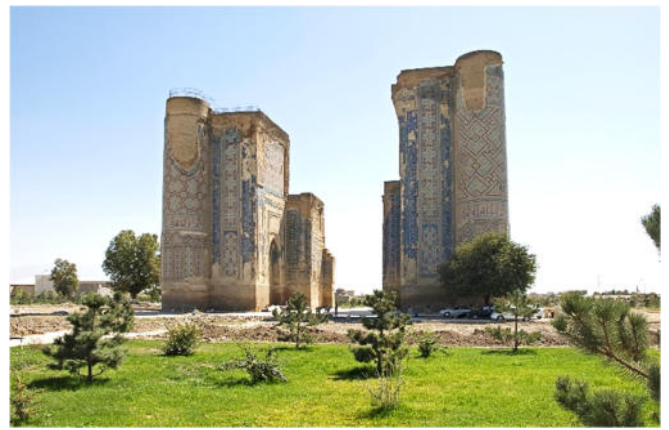
Ak-Sarai-Palast CCBYSA4.0 Ymblanter at-wikimedia.commons

Über den Gebirgspass Tachta Karatscha führt die Reise weiter nach Schachrisabz der legendären Geburtsstadt Timurs. Sie zählt den frühen Zentren seiner Herrschaft . Gegründet wurde die als grüne Stadt bekannte Siedlung bereits im 3. Jh. v. Chr. Im 14. Jh. entstanden unter dem ehrgeizigen Mongolenfürsten eindrucksvolle Bauten, die er mit einer 11 m hohen und bis zu 5 m dicken Mauer befestigen ließ.