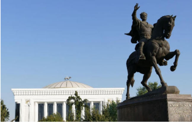
Amir-Timur-Platz