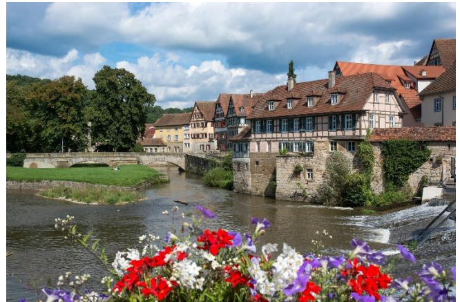
Schwäbisch Hall

Am Abend Ankunft in Ihrem komfortablen Standort-hotel in Schwäbisch Hall . Sie wohnen im Ringhotel Hohenlohe , einem Gebäudeensemble direkt am Ufer des Kochers mit Schwimmbad und Wellnessbereich. Die Altstadt erreichen Sie nach einem kurzen Spaziergang über die nahe Henkersbrücke. Nach dem Zimmerbezug für 3 Übernachtungen klingt der Tag mit einem gemeinsamen Abendessen aus.