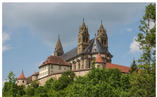
Kloster Großcomburg

Zum Auftakt des Tages fahren Sie zum ehemaligen Benediktinerkloster Großcomburg, das majestätisch auf einem Bergrücken über dem Kochertal liegt. Die ersten Mönche der im Jahr 1078 gegründeten Abtei kamen aus Brauweiler . Im Zentrum der burgartigen Anlage mit Wehgang und Ringmauer thront die Stiftskirche St. Nikolaus und St. Maria . Vom romanischen Vorgängerbau der barocken Hallenkirche sind die weit hin sichtbaren Türme erhalten geblieben. Bei einer Führung bewundern Sie mit dem großen Radleuchter und dem vergoldeten Antependium zwei wertvolle Schätze mittelalterlicher Handwerkskunst.