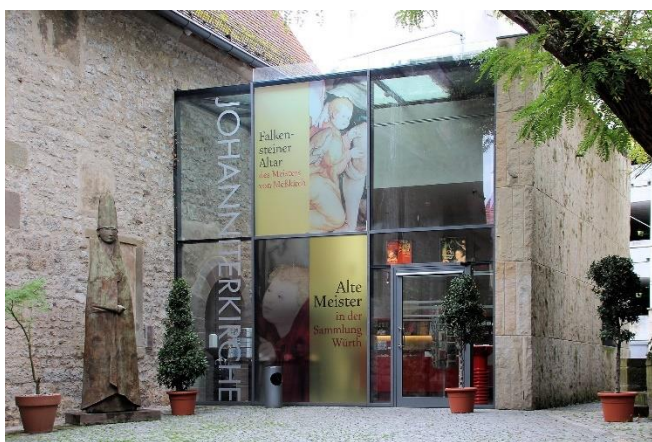
Johanniterkirche

Nach dem Frühstück erfolgt der Check-out und Ihr Gepäck verbleibt im Hotel. Ein kurzer Spaziergang führt zur säkularisierten Johanniterkirche , die seit 2008 ebenfalls ein Museum beherbergt. Das umfassend renovierte Kirchengebäude aus dem 12. Jh. bildet den würdigen Rahmen für die Alten Meister in der Sammlung Würth . Zu den Höhepunkten der Ausstellung zählen wertvolle Tafelbilder von Lucas Cranach dem Älteren und die berühmte Schutz-mantelmadonna von Hans Holbein dem Jüngeren.