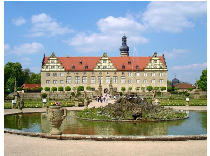
Schloss Weikersheim

Nur wenige Kilometer entfernt liegt im Taubertal Schloss Weikersheim . Auf den Mauern einer mittelalterlichen Wasserburg errichteten die Grafen von Hohenlohe am Ende des 16. Jahrhunderts eine prachtvolle Anlage im Stil der Renaissance , deren dreieckiger Grundriss architektonisch einzigartig ist. In dieser Zeit entstand auch der Saalbau mit dem Rittersaal und die Gartenfassade mit ihren markanten Giebeln. Im Anschluss an Ihre Schlossführung bietet sich die Gelegenheit zu einem Spaziergang durch den wunderschön angelegten Park.