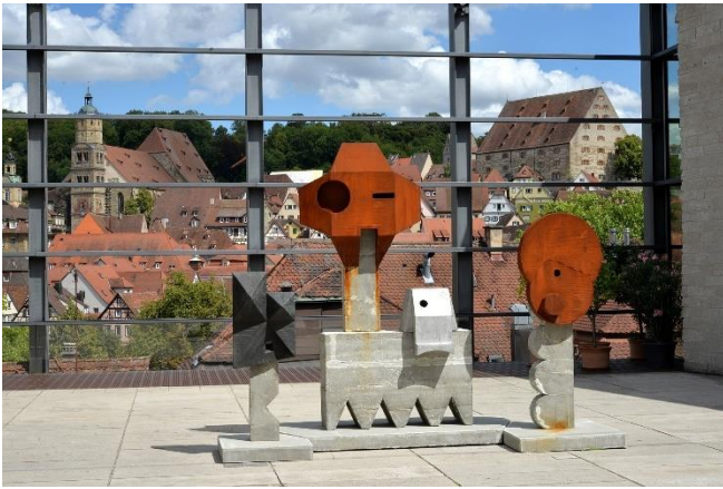
Blick von der Kunsthalle Würth auf die Altstadt von Schwäbisch Hall

Gezeigt werden Wechselausstellungen moderner und zeitgenössischer Kunst. Nach einer umfangreichen Erweiterung wird das Museum mit der Ausstellung „ Anselm Kiefer. Sammlung Würth und Leihgaben “ im Herbst 2026 wiedereröffnet. Freuen Sie sich auf eine abwechslungsreiche Führung durch eine eindrucksvolle Werkschau des bekannten Künstlers, der eine langjährige persönliche Verbindung mit Reinhold Würth pflegt.