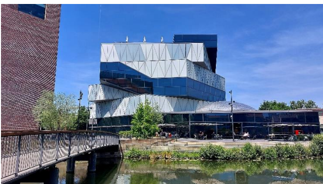
experimenta Heilbronn CCBYSA4.0 5R-MFT at-wikimedia.commons

Nach einer individuellen Mittagspause im hauseigenen Restaurant werden Sie zu einer informativen Führung durch die Ausstellungsbereiche „Entdeckerwelten“ und „Erlebniselwelten“ erwartet. Dabei ergeben sich auch spannende Einblicke in die außergewöhnliche Architektur des Gebäudes.