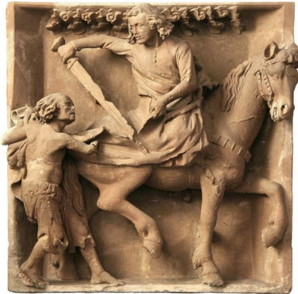
Bassenheimer Reiter

Die Abfahrt erfolgt am Morgen im modernen Reisebus von Brauweiler aus. Zustieg ist bei der Haltestelle Köln Weiden-West möglich. Durch die Eifel erreichen Sie den kleinen Ort Bassenheim , dessen Pfarrkirche St. Martin einen besonderen Schatz beherbergt: Den Bassenheimer Reiter , der den hl. Martin beim Teilen seines Mantels zeigt, gilt als Meisterwerk frühgotischer Steinmetzkunst . Das um das Jahr 1240 für den Mainzer Dom gefertigte Relief wird dem „Naumberger Meister“ zugeschrieben und kam 1683 hierher. Lassen Sie sich von der eindrucksvollen Darstellung begeistern!