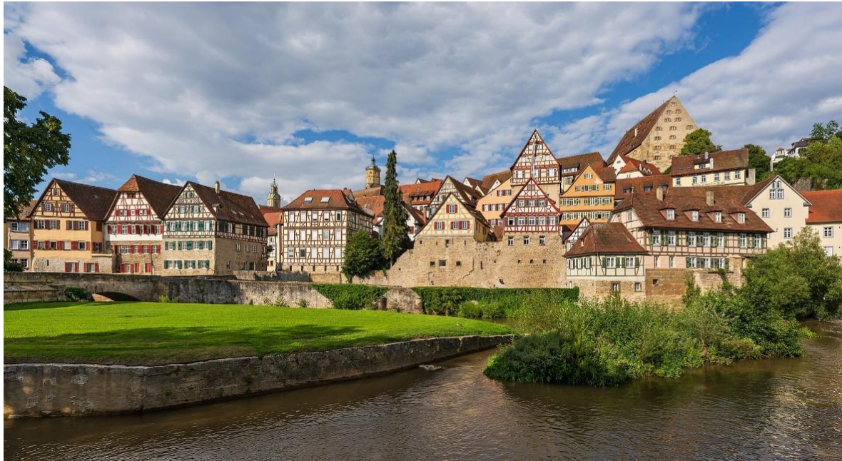
Schwäbisch Hall

Im Norden von Baden-Württemberg erwartet Sie mit dem Hohenloher Land eine Region wie aus dem Bilderbuch , die Eduard Mörike als „ besonders zärtlich ausgeformte Hand Deutschlands “ beschrieb. Die Flüsse Jagst, Tauber und Kocher schlängeln sich durch eine idyllische Landschaft mit sanften Hügeln, saftigen Wiesen und scheinbar endlosen Feldern.